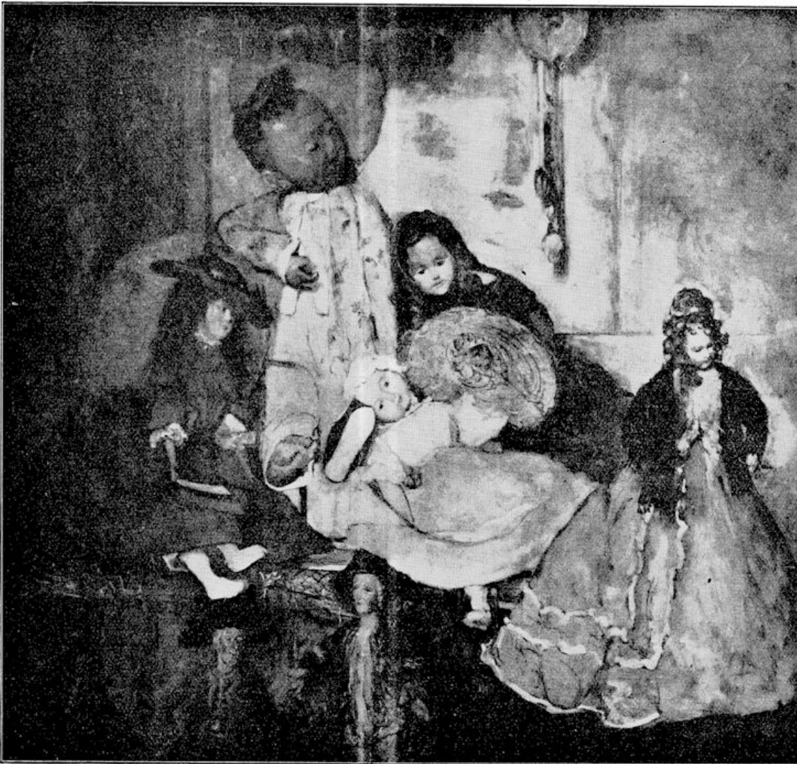
Het Gele Gevaar