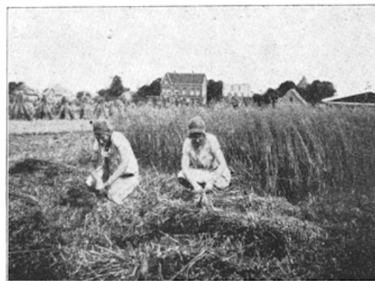
Helpsters van den boer.

Aan de koffietafel, waar nu bijna alle meisjes aanwezig waren, werden plannen gemaakt voor