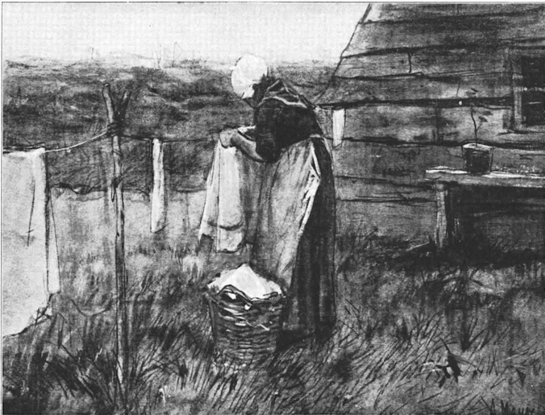
Washvrouw bij de schuur.

's Avonds, terwijl ze probeerde helderheid te brengen in een wiskunde vraagstuk, hoorde ze beneden de huiskamer zich steeds meer meten met stemmengeroes. Soms waren er oogenblikken van stilte; doordat het avond aan avond precies eender ging, wist ze: dan verdiepten vader en de jongens zich in de krant.