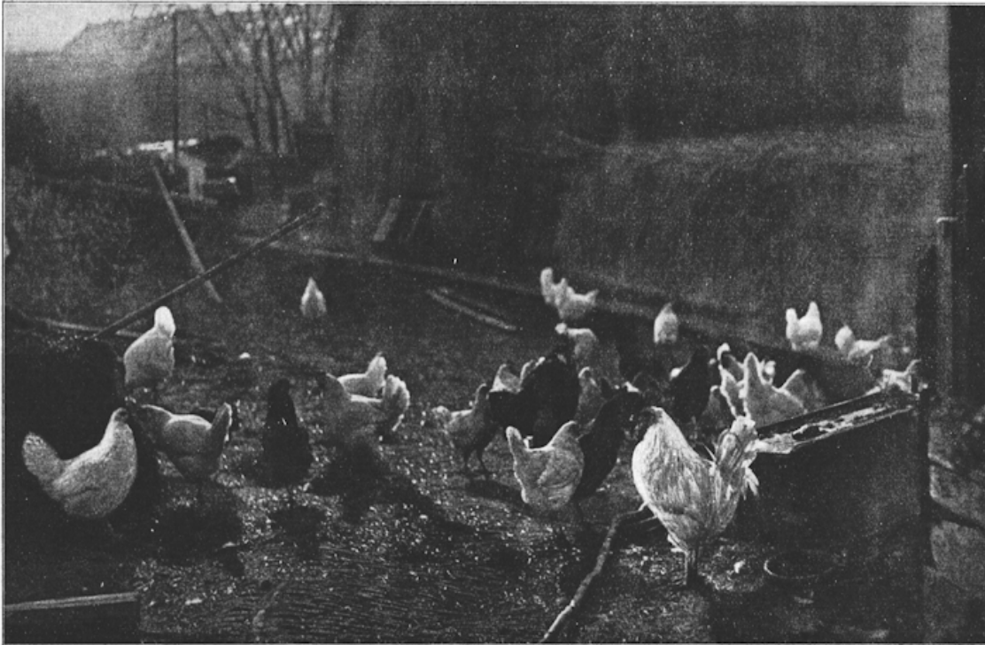
Achter de oude schuur.