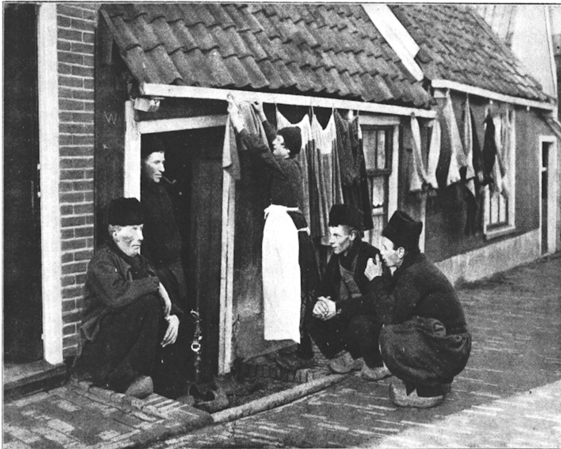
De wasch moet drogen.