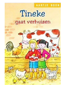
Tineke gaat verhuizen 75 blz., [4de druk 2011] Ill. Jaap Kramer Uitgever den Hertog, Houten Recensie(s) :