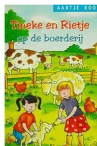
Tineke en Rietje op de boerderij 70 blz., [9de druk ] Ill. Jaap Kramer Uitgever den Hertog, Houten Recensie(s) :