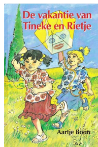
De vakantie van Tineke en Rietje 108 blz., [1ste druk 1995] Ill. Jaap Kramer Uitgever den Hertog, Houten