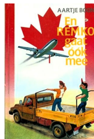
En Remko gaat ook mee 72 blz., [1ste druk 1987] Ill. Johan van Dongen Uitgever den Hertog, Houten Recensie(s) :