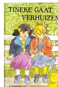
Tineke gaat verhuizen 71 blz., [1ste druk 1991] Ill. Jaap Kramer Uitgever den Hertog, Houten Recensie(s) :