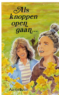
Als knoppen opengaan... [1ste druk 1990] Ill. Jaap Kramer Uitgever den Hertog, Houten Recensie(s) :

Zie ook http://www.uitgeverijdenhertog.nl/auteur/13/Boon-Aartje