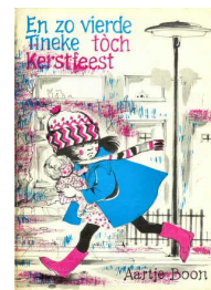
En zo vierde Tineke tóch kerstfeest 36 blz., [1ste druk ] Ill. Reintje Venema Uitgever G.F. Callenbach, Nijkerk Recensie(s) :