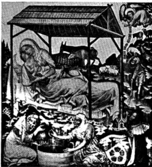
Geboorte van Christus, door een Hohenfurtschen meester uit de 14e eeuw.

Die stal lijkt wel niet altijd op wat wij ons daarvan in het Noorden gewend zijn voor te stellen. In het oude werk van den Hohenfurtschen Meester, waar door een gebrekkige ruimte-weergave de vele tafereeltjes wel boven, inplaats achter elkaar lijken te staan, doet de stal dadelijk denken aan het „open huus op vier pooten” dat volgens de oude beschrijvers van het Kerstgebeuren door de Oostersche marktgangsters gebruikt werd om er tijdelijk hun vee in te brengen.