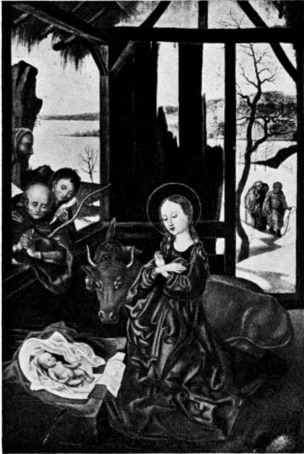
Martin Schongauer, 15e eeuw: De aanbidding der herders.

Er is wel geen feest in het jaar, dat zoo zijn glanzend blijde en tegelijk intiem vertrouwelijke sfeer heeft weten te behouden, als het feest rond het Kerstkind. Maar er is ook wel geen feest, dat de gebeurtenissen, welke het herdenkt, zoo vaak in de kunst van alle eeuwen uitgebeeld zag.