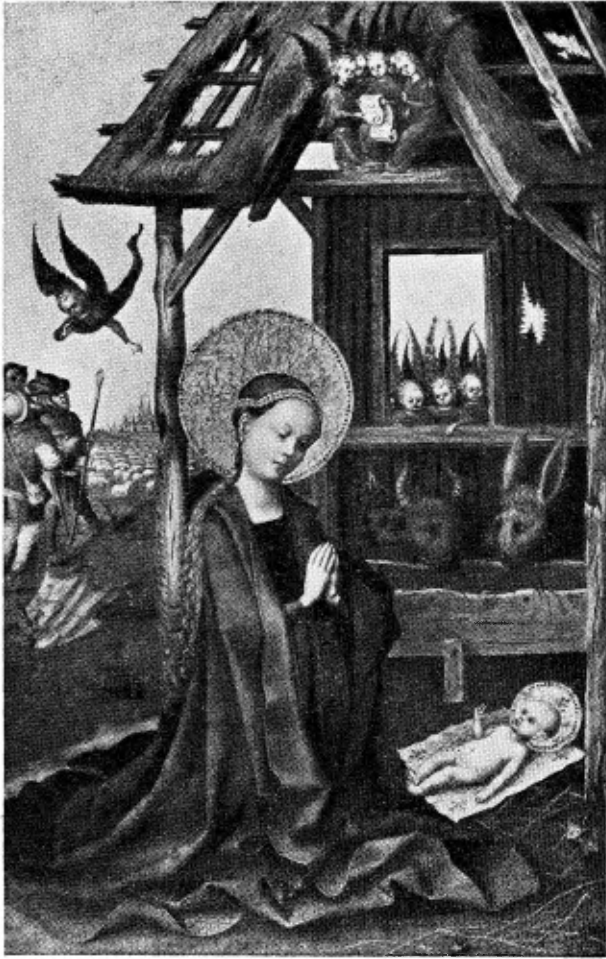
Stefan Lochner, 15e eeuw: Maria, die het Kind aanbidt en de boodschap aan de herders.

Ook de herders, eenvoudige vromen uit het volk, kregen ruim plaats in deze voorstellingen en hoe heeft men er, juist als in de oude liedekens, graag de van zoo ver gekomen koningen eveneens in het vertrouwde Noordsche winterlandschap uitgebeeld. Hoe laten ze ons zien wat een bedoening hun komst in een eenvoudig boerendorp van onze streken gaf; hoe loopt er ieder uit om dien wonderlijk zwarten Moorenkoning te zien.