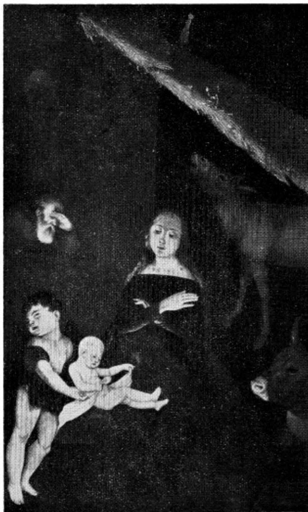
Hans Baldung, 16 eeuw: Geboorte van Christus.

Ook de stal op de schilderij van den Vlaamschen schilder Van der Goes, lijkt niet op die waaraan we bij de Kerstverhalen denken. Men zou veeleer meenen in de ruïnes van een oude kerk te zijn. Maar hoezeer helpt tusschen al de schilderachtige pracht, die dit werk ons toont, de aanwezigheid der twee dieren mee de vredige stemming te verhoogen. En toch knielen of spreken ze niet. De os staat het alles slechts goedmoedig te bezien. Maar hun stoere verschijning achter Maria en het Kind roepen de verzen van een oud Kerstlied in ons op: