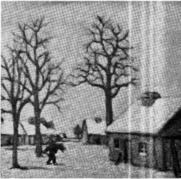
Kempisch dorp in wintertijd.

rond de tafel wordt geveegd; een tafel van withouten planken, die te voren goed is geboend, want er is geen kleed dat ze bedekt, hoogstens een zeiltje dat met koperen pennen op het blad is vastgenageld. Het is alles zoo sober; zelfs geen gordijnen bedekken het kleine venstervierkant. Maar waarom zou men ook het uitzicht breken op de heidevlakte onder de ontzaglijke, bewogen winterluchten? Blikken van nieuwsgierige menschen storen hier niet in de eenzaamheid. Daar trekt hoogstens een geestelijke voorbij op weg naar zijn abdy; of daar klopt een Clarissenzuster aan om een gave voor haar kloostergenooten, of er trekt een „troubadour” door het land en vedelt bij een hoevehut een ouderwetsche deun. In de dorpsuizen, waar de vrijheid van de vlakte niet geldt, kan men echter met naakte vensters niet toe. Toch bleef ook zonder gordijnen het licht maar schaarsch. Al vroeg verdicht zich de schemer onder de lage balkenzoldering en schaduwts langs de witgekalkte muren. Maar dit gedempte licht geeft aan het sobere interieur die eigene intieme sfeer, die hoort bij de stilte welke rond deze zwijgend doende, ernstige levens hangt. De sfeer, die ook zoo wondergoed past rond de kleine stal van Bethlehem, die straks in de hut wordt opgericht, met de os en de ezel, de herders en de schaapjes en met het kribje middenin, vaak door de vader zelf gesneden in primitieve vormen