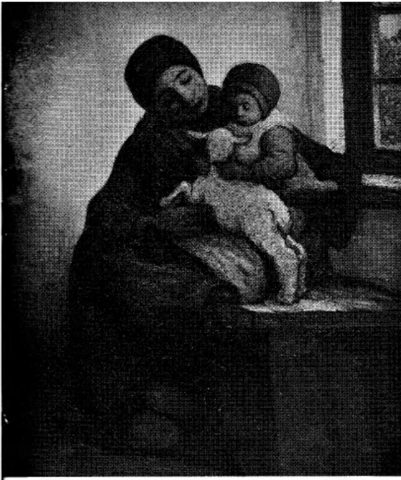
Kempische moeder met haar kind.