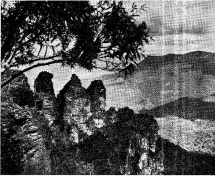
De wereldberoemde Blue Mountains.

gekleed dus. In veel moet het jonge Australië nog zijn eigen vorm vinden, het kan niet steunen op een eigen verleden en historie. Het bestaat nog maar ruim 150 jaar en geweldig veel heeft het reeds gepresteerd, maar in lang niet alles heeft het zijn eigen vorm gevonden. Zoo is het ook met de kleding der vrouwen en ik wijd hier zooveel aandacht aan, omdat ik bemerk heb welk een rol de kleding er speelt. De vrouwen zijn op elk uur van de dag wanneer ze het huis uitgaan, zóó mooi gekleed, dat er van een climax geen sprake kan zijn. Ze schijnen de grens niet te weten. Men ziet in de groote steden bijvoorbeeld in de morgenuren, de winkelende dames gekleed op een wijze, alsof ze naar een tuinfeest gaan. Hoe moeten ze er dan 's middags wel uitzien en 's avonds?