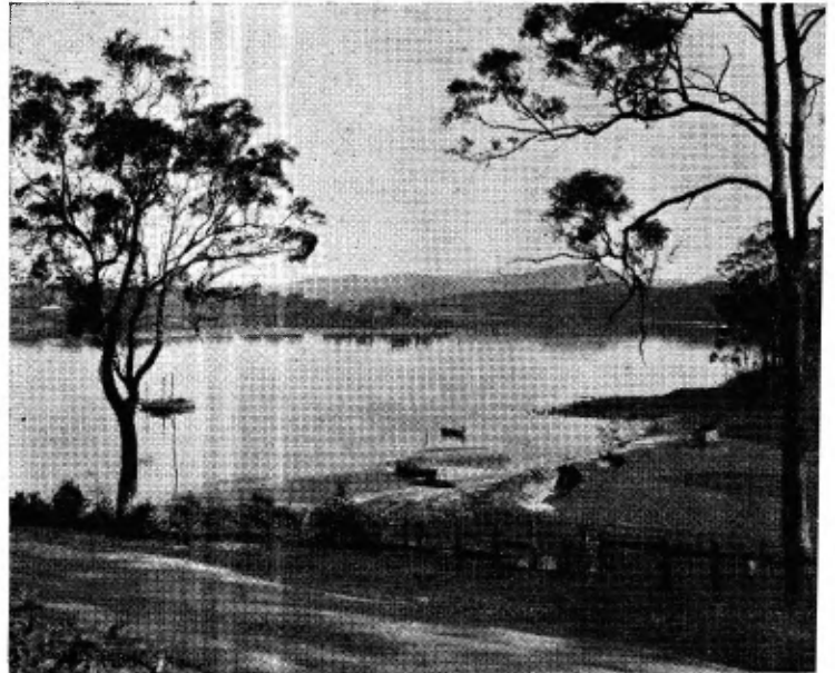
Idyllisch Australisch landschap.

Bij de grootere afdelingen is er een leeskamer en bibliotheek aan verbonden en men is er door tijdschriften en voorlichting altijd op uit elkaar te helpen. De leden wonen soms heel ver uit elkaar en daarom geschieden de bijeenkomsten ook wel aan huis. Dit zijn altijd prettige gebeurtenissen die de eenzaamheid zeer onderbreken. Er zijn afdelingen van honderden leden, er zijn er ook van maar zeven