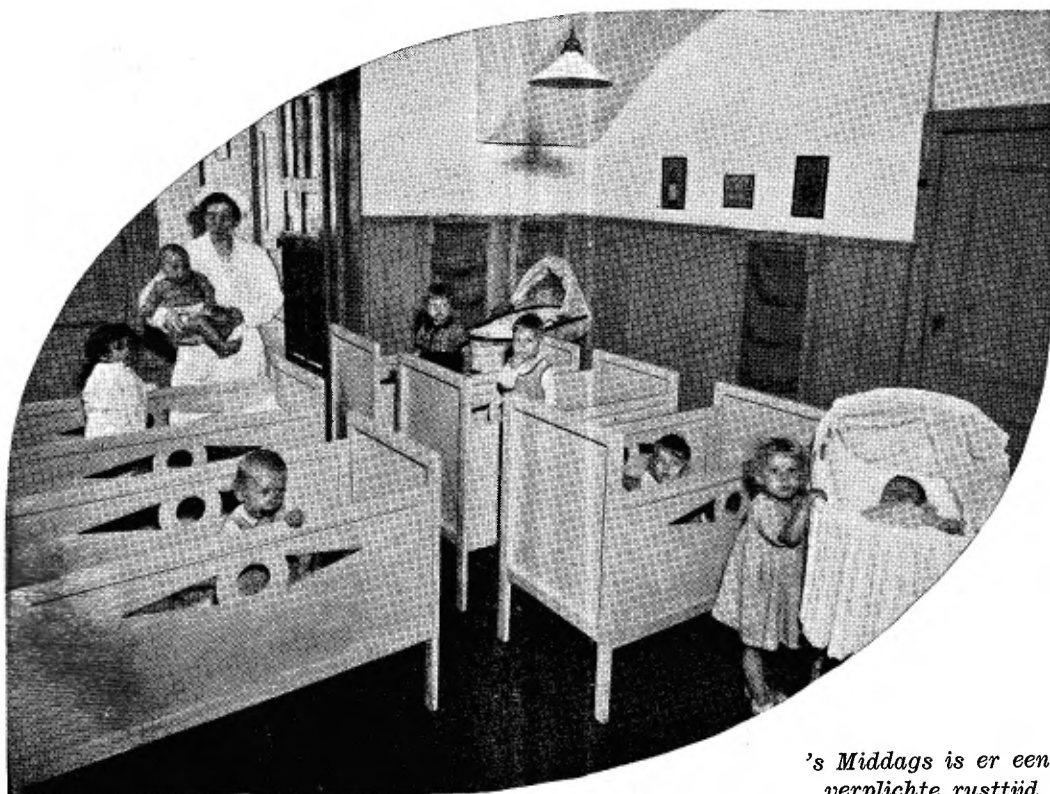
's Middags is er een verplichte rusttijd. 3

Zooals ik reeds zei: we willen ons ditmaal niet verdiepen in de vraag, of het een misstand is, dat de