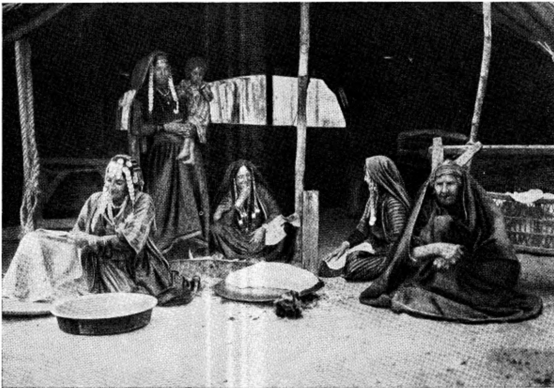
Bedouinen bij het broodbakken