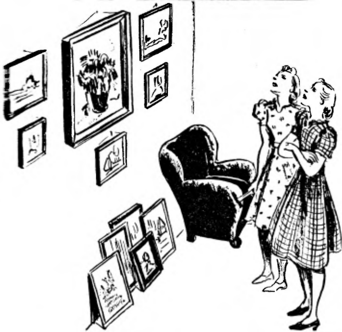
Op jacht naar kale plekken — helaas, ze zijn er niet.