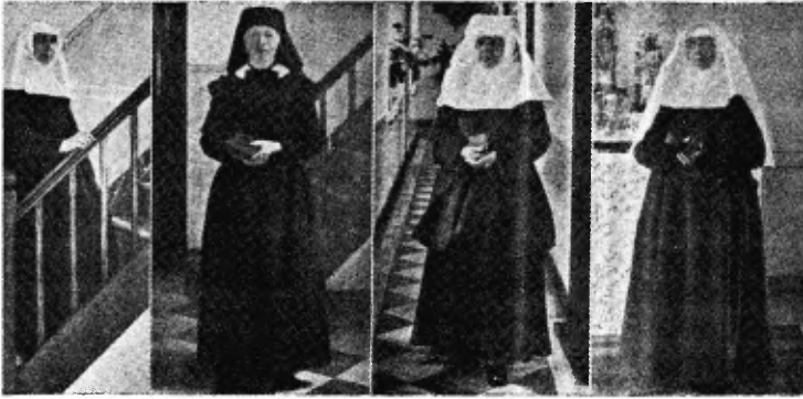
eedij binnenshuis. Een novice. Naar de kerk. In de kerk.