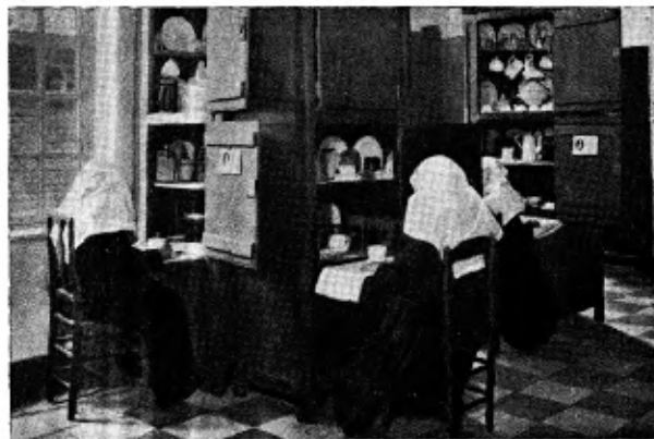
De Refter met de schapraaien.

Het zijn vooral de paters Dominicanen, die met de geestelijke leiding belast zijn. Vandaar dat men gemakkelijk in de stille straatjes van zoo'n begijnendorp een van de vriendelijke en bedrijvige zonen van St. Dominicus ontmoeten kan in zijn wit ordekleed, waarover de zwarte mantel los is omgeslagen. Op de klinkerstraatjes hooren de begijntjes al gauw zijn vlotte stap en schieten graag hun poortje uit om even met hem een praatje te maken.