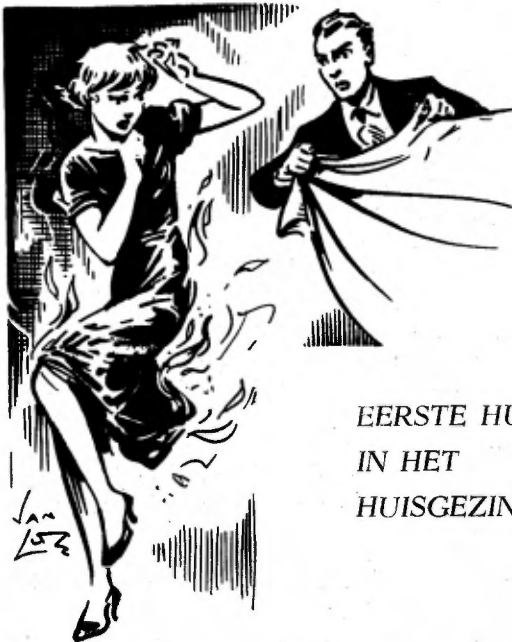
EERSTE HULP IN HET HUISGEZIN

Even een heete kachel aangeraakt, of een lucifer te lang vastgehouden, wie heeft niet de gevolgen daarvan aan den lijve gevoeld? Ook leest ge wel eens van kindertjes, die kokend water over het lichaam kregen, of van ongelukken door het vlam vatten van kleren, bij voorbeeld door een omvallend petroleumstel of door een ander open vuur.