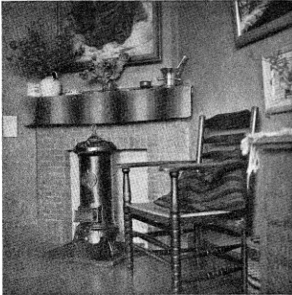
Datzelfde „Oud-Hollandse“ gevoel gaf de huiskamer.

aandacht waard. In een schildersatelier vinden wij altijd weer verrassende hoekjes en zitjes, die wij ook in ons eigen huis, hetzij in woon- of studeerkamer zonder veel moeite of kosten zouden kunnen aanbrengeu. Let u bijvoorbeeld eens op de divan langs de wand en kijkt u dan eens hoe de schilder hier een zestal van zijn werkstukken ophing.