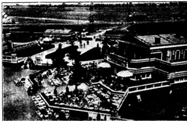
Vliegveld Waalhaven. Hoe lokt daar links in den hoek het aardige restaurant.

Hoe lokt daar links in den hoek het aardige restaurant met zijn breede terrassen, waar men onder kleurige parasols het aankomen en vertrekken der reuzevogels gade kan slaan. Een krachtige luidspreker-installatie zorgt er voor dat het publiek volledig op de hoogte wordt gehouden van de uitvoering van den dienst.