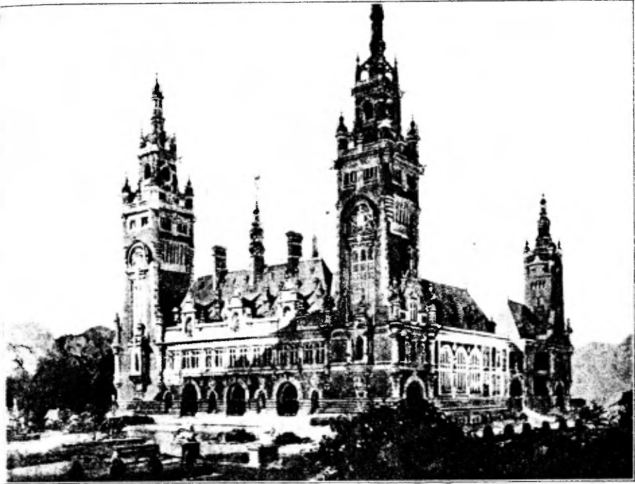
Ontwerp van den Franschen architect L. M. Cordonnier te Rijssel, bekroond met den eersten prijs.

op de hoogte zal zijn van al, wat de Raad van Beheer nog aan plannen heeft met het park en den omtrek, de critiek zeer zeker verscheidene tonen lager zal hebben te zingen.