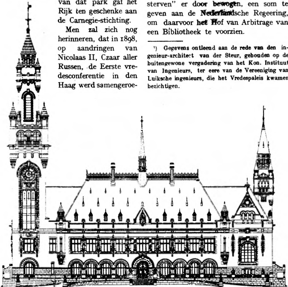
Voorgevel van het in aanbouw zijnde Vredespaleis te 's Gravenhage. Architecten: L. M. Cordonnier en J. A. G. van der Steur.

1) Gegevens ontleend aan de rede van den ingenieur-architect van der Steur, gehouden op de buitengewone vergadering van het Kon. Instituut van Ingenieurs, ter eere van de Vereeniging van Luiksche ingenieurs, die het Vredespaleis kwamen bezichtigen.