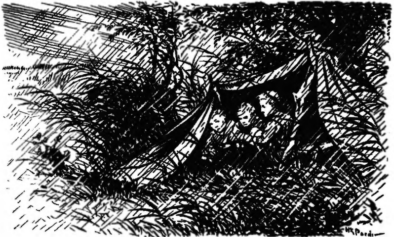
De regen klettert! De storm raast.

„Als 't buiten woedt, is 't binnen zoet,“ rijmt Jaap