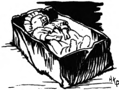
Netjes aangekleed en in een doos gelegd.

Het cadaver werd wat drooggewreven, netjes aangekleed en in de doos gelegd.