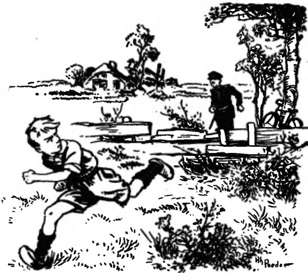
En holde als een haas het land in.