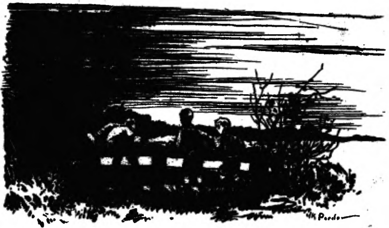
Au, Jurrien blijft vastzitten . . . .

vastzitten aan prikkeldraad. Hij rukt zich los, wat kan het hem schelen! Ze steken een weiland over, klauteren over een Drents walletje, strompelen over bouwland, lopen vast voor een sloot, lopen, zoeken, speuren, vinden een hek. Het lichtje verdwijnt, ze keren terug, het lichtje pinkelt weer, ze vinden een paadje . . . . ze vinden een huis en dat huis staat aan de verharde weg! Is dit de weg naar Leek? Ze weten het niet. Moeten ze rechts of