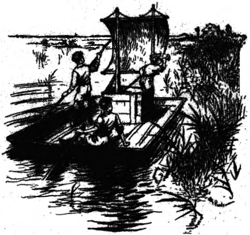
De Noord-Oostenwind is in het zeil gekomen (Zie blz. 68).