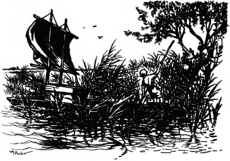
Hij worstelde uren om weer los te komen.

bracht door middel van twee dikke krammen een nieuw roer aan. Enkele reten werden opnieuw dichtgestopt, met uitgeplozen touw. Hij bevestigde een afdakje van zakken en asphalt boven de kist, zodat ze een schuilplaats hadden tegen de regen. Een nieuwe, breder loopplank werd aan boord gebracht. Hij maakte een proeftochtje op eigen houtje in het Oude Gat. Hij geraakte