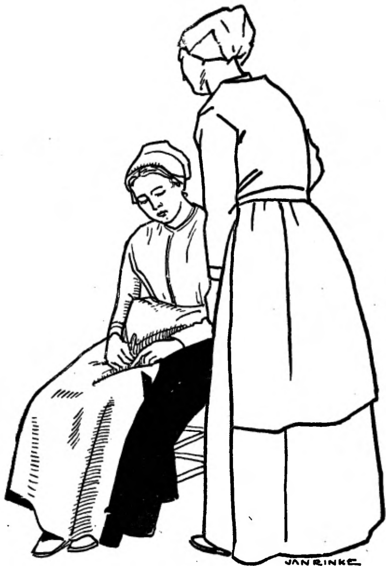
Tevergeefs pogde hare moeder haar op te beuren . . . .