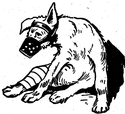
Met een nieuw verband om de zere poot en zwaar gemuilkorfd.

„Jongen, je ziet 't toch zelf wel. Je hond werkt niet mee. Dat maakt het juist bij dieren zo moeilijk. Als Onne nou jou was, of Wim, dan konden we