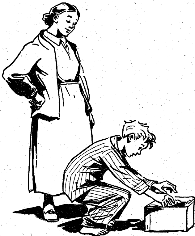
Hij boog zich voor moeder om over het hondje heen.