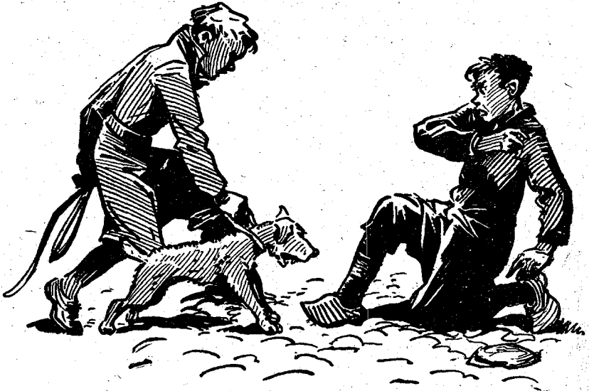
Hij greep Onne bij de halsband en maakte hem vast.

„Dan zul je het nu wel voor altijd verder uit je hoofd laten mij te zoeken, niet?” ging Kees verder. Dolf beloofde maar al te graag.