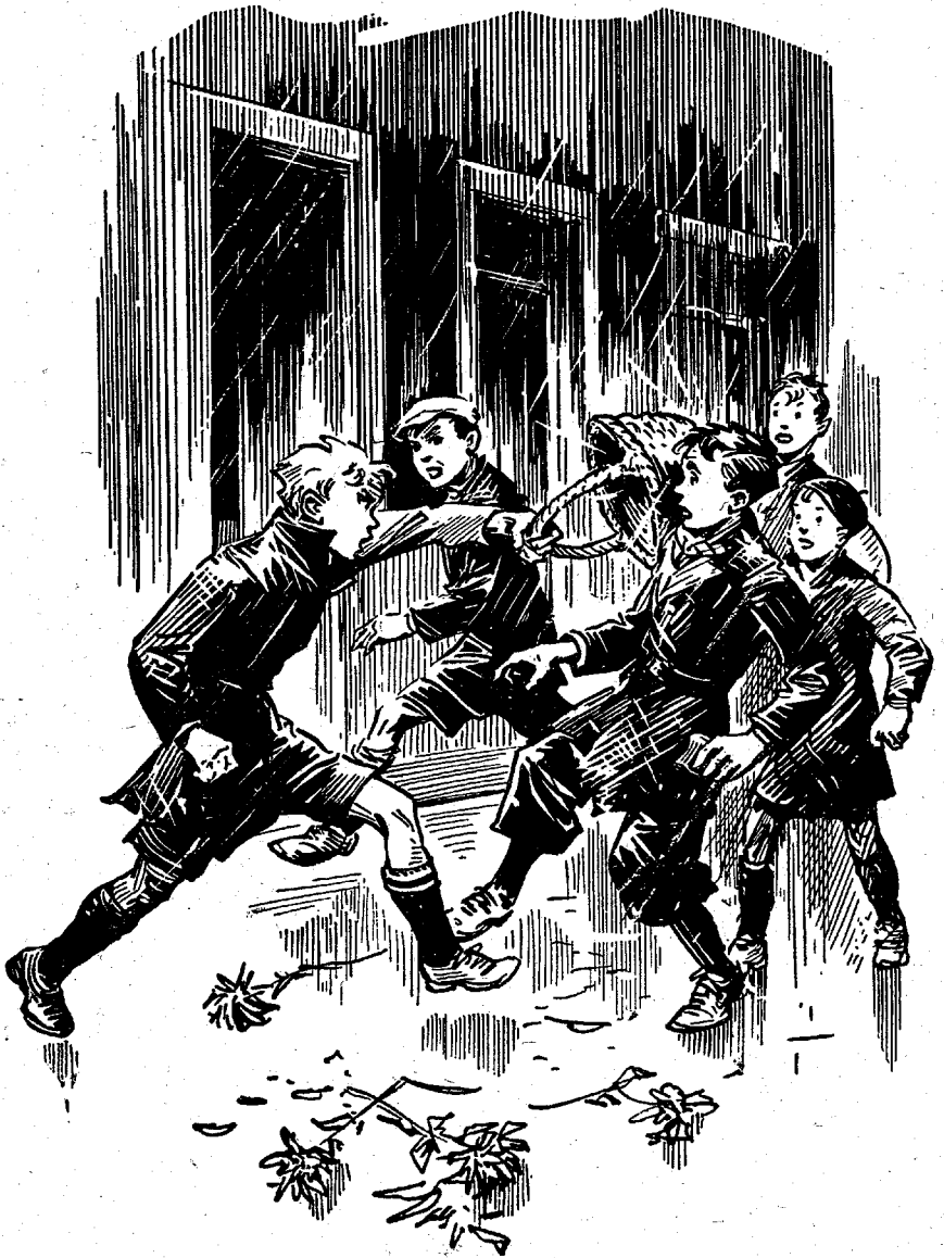
HIJ STORMDE NAAR VOREN MET ZIJN MAND BOVEN ZIJN HOOFD. (Blz. 21).