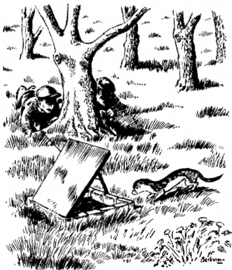
Voorzichtig sloop de bunzing opnieuw naar de mussenknip