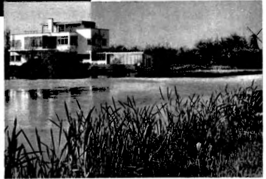
Het huis gezien van de „Oude IJclub”

Laten we nu de woonsuite betreden, die goed overdacht op het Zuiden is gelegen en tegen de vandaag zeer felle zonneshijn behoed wordt door groote, oranje zonnezeilen. Die kijkt in zijn volle lengte uit op de tuin. We zijn eenige treden boven de begane grond en de tuin is van hieruit gezien een sprookje van schoonheid. De ramen aan de Plaszoom zien uit op de Plas, naar links; op de achtergrond, kabbelt de „Oude IJclub”. Het kost moeite, de oogen en de gedachten los te maken van de buiten. Maar het interieur van het huis eischt nu de aandacht en vervult ons ineens en geheel van bewondering. Zooveel ruimte! En toch zoo gezellig! Werkkamer, zitkamer en eetkamer rijen zich aaneen. Zeer wijd zijn de doorgangen. Toch kunnen de kamers geheel van elkaar afgesloten worden. Het smalle penant opzij bergt onzichtbaar drie glazen deuren, die naast elkaar geschoven kunnen worden. Als dan de gordijnen ervoor dichtgetrokken worden, is de intimiteit van het vertrek volkomen. Als een voornaam feest waren de kleuren van vloerbedekking en meubels.