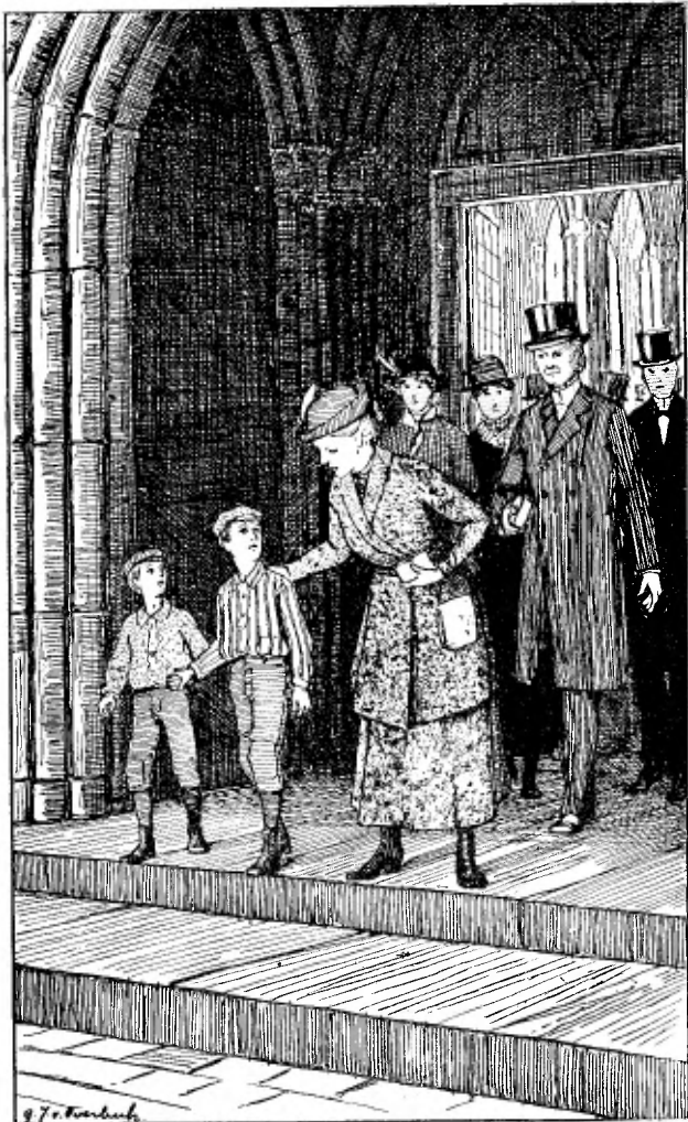
Een dame zag hen in de kerk.