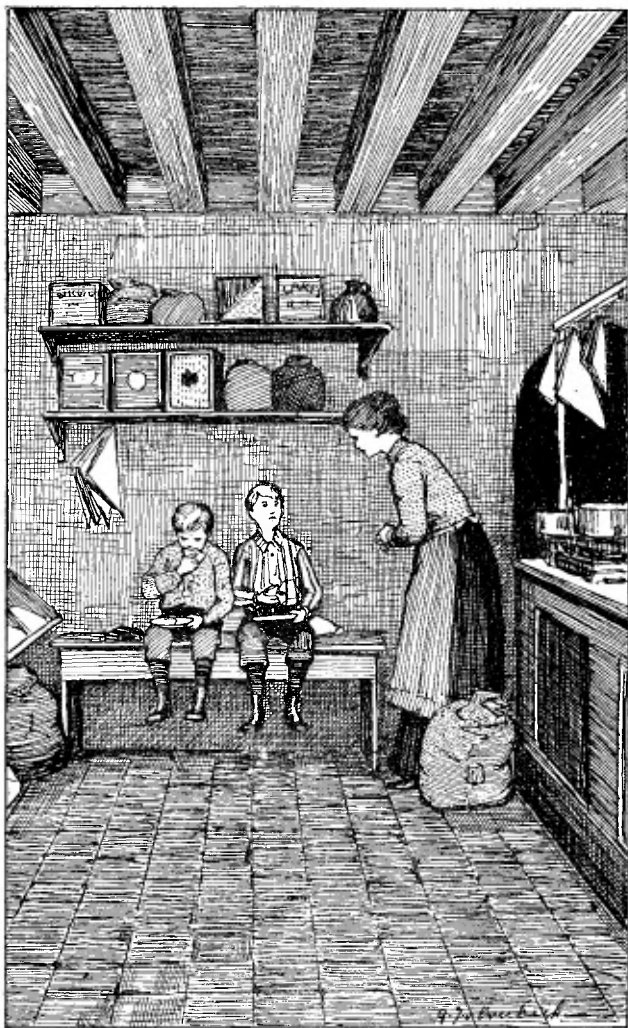
Riep ze in, en sneed hun 't morgenbrood.