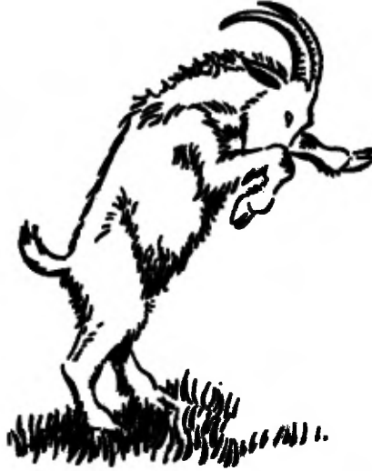
Die stond alweer op zijn achterpoten

Vader keek verbaasd achterom. Toen zag hij den bok. Die stond al weer op zijn achterpoten voor de tweede aanval. Toen lachte vader ook. Hij had het dier met één greep bij zijn grote horens. De bok draaide en wrong met zijn kop. Maar hij kon niets meer beginnen. Vader