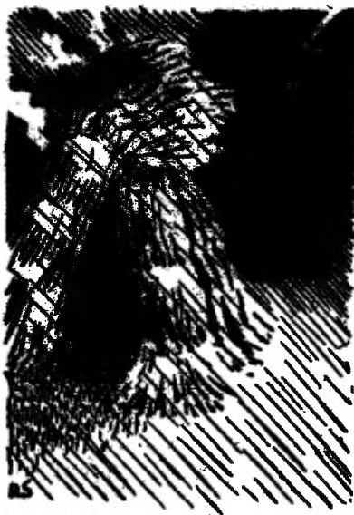
Vurige vlammen sprongen langs de zwarte hemel.

naar moeder toe. Maar opeens was het, alsof er vuur van de hemel viel. Vlak daarop knetterde een zware donderslag. Ik kromp ineen. Hans sloeg de handen voor de ogen. Hanneke gilte het uit. Toen kroop ik maar gauw bij hen onder het koren. Ze schoven naar mij toe en kropen dicht tegen mij aan.