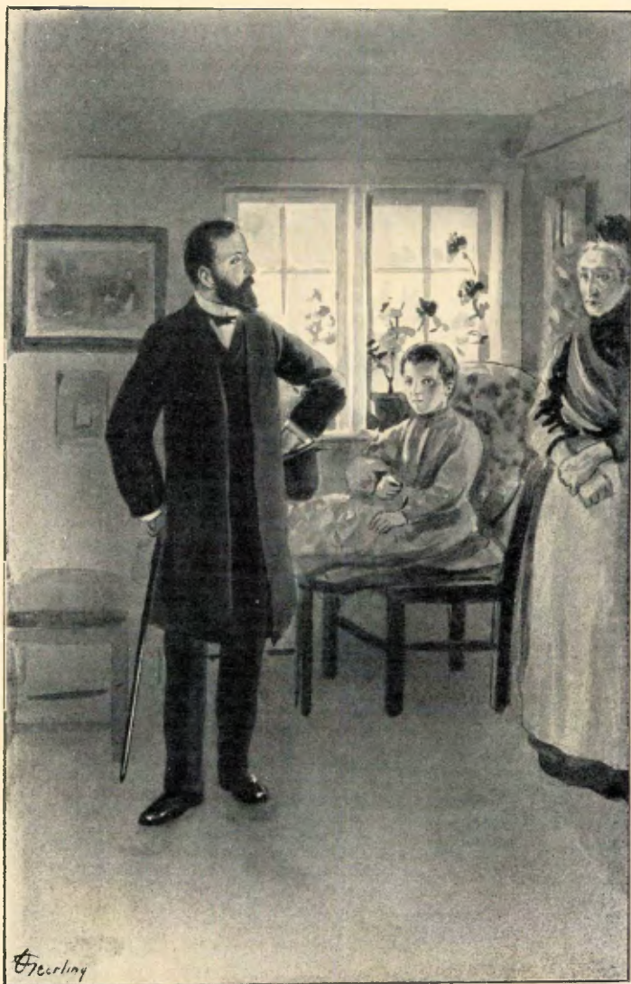
De dokter gaf nu uitvoerige aanwijzingen aan grootje. blz. 39