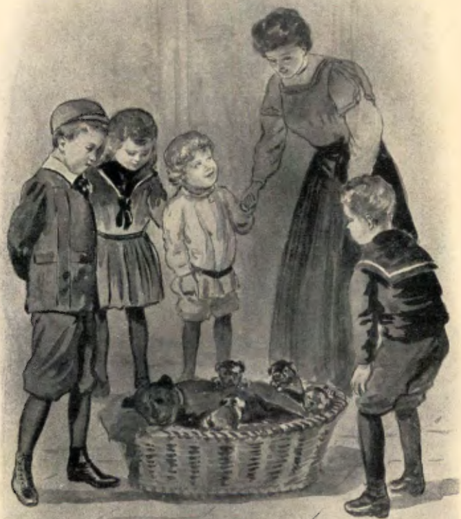
Het was een vroolijk gezelschap dat de jonggeborenen bezocht. blz. 5