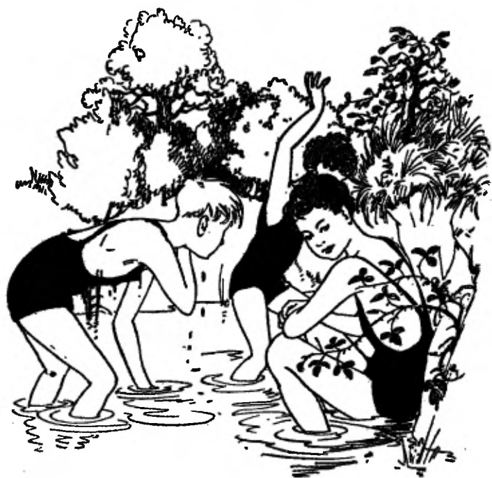
TEKENINGEN VAN NANS VAN LEEUWEN