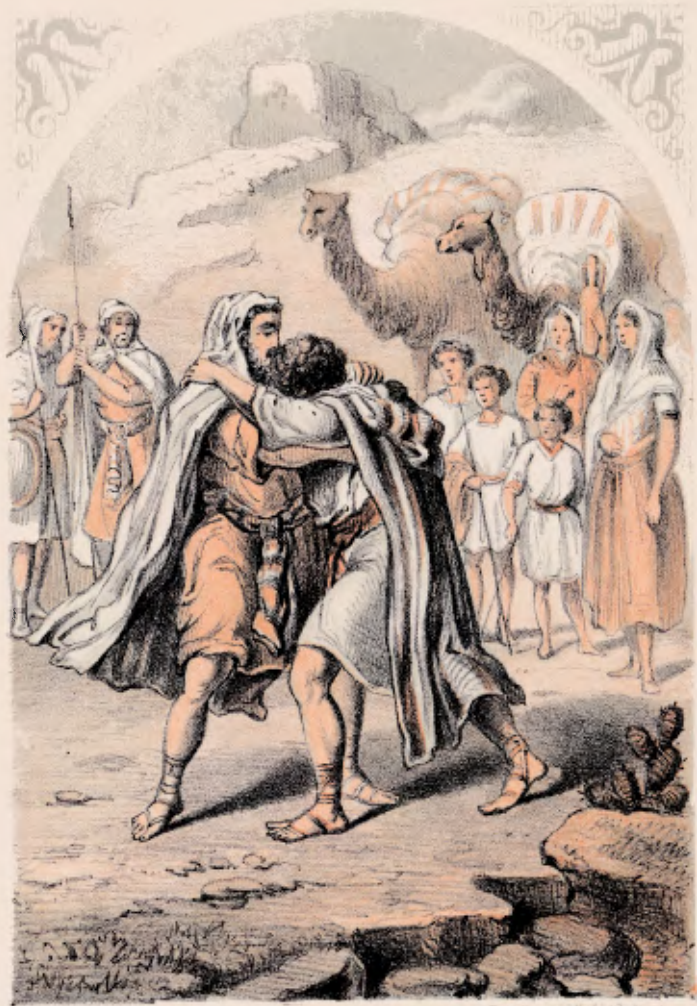
The Meeting of Jacob and Esau