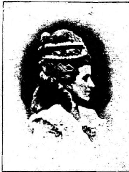
Pouf à la Cerf-Volant.

Hoe echter de uitdrukking van 't gelaat afwisselde, hoog, hoog-ernstig bleef 't. Zoo ernstig zal dus ook de ziel geweest zijn. Doch toen drie, vier dames zich glimlachend omwendden naar twee heel povere kindertjes,