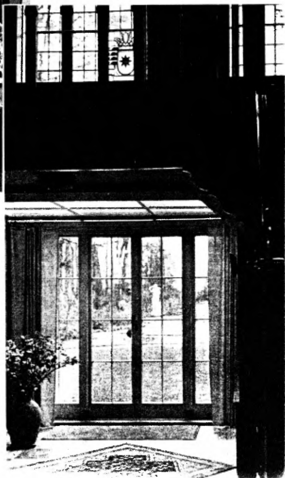
Trappenhuis en uitgang naar de achtertuinen