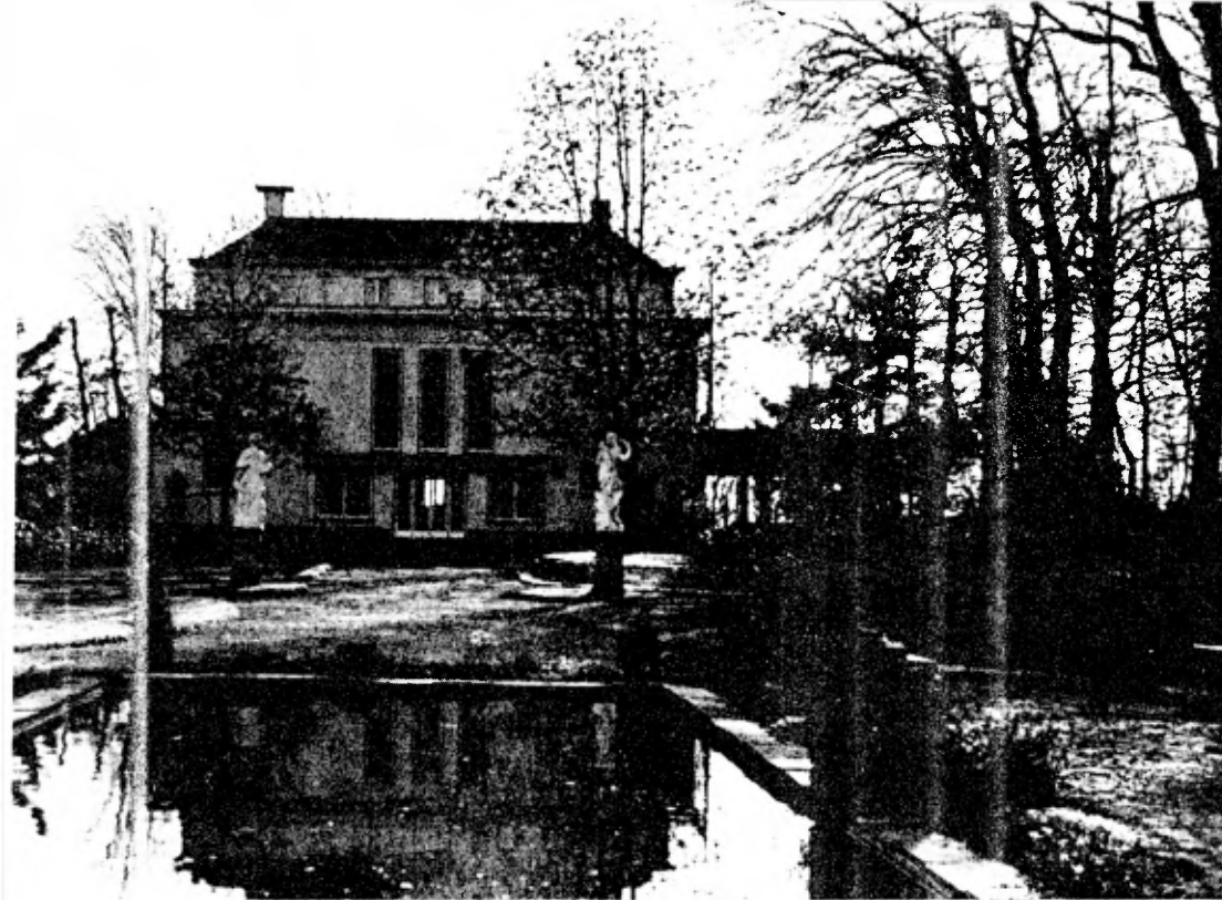
Achterzijde van „Den Tempel“.