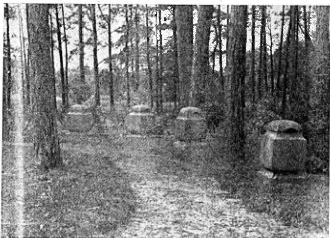
Donker-blauwgroene urnenvazen. Brouwers aardewerk

Hier en daar was al een aanplanting van rhododendrons te zien. Kent ge de schoonheid van bloeiende rhododendrons onder hoog dennenhout? Nooit komen de teere, de felle, de somber paarse tinten der geliefde bloemen beter uit dan in een bosch, onder de hoge boomen, op mosgrond.