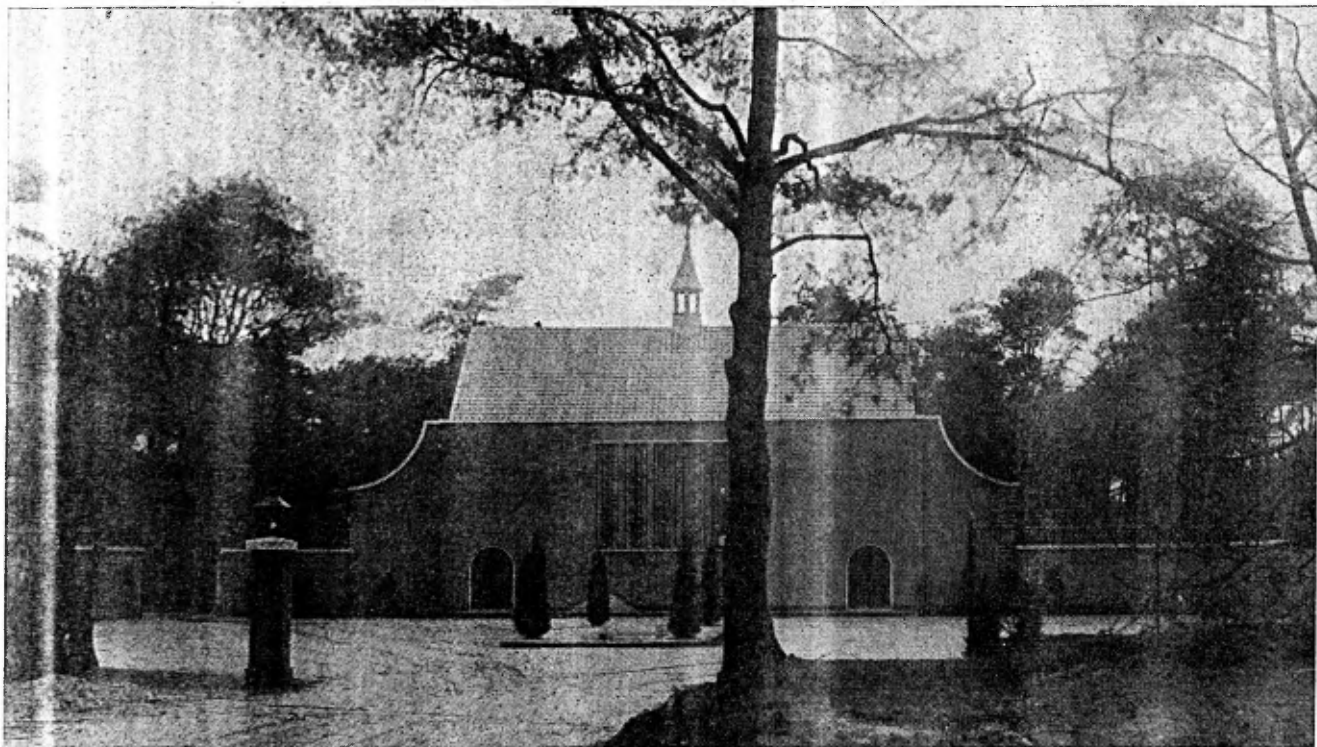
Aula van de begraafplaats af gezien