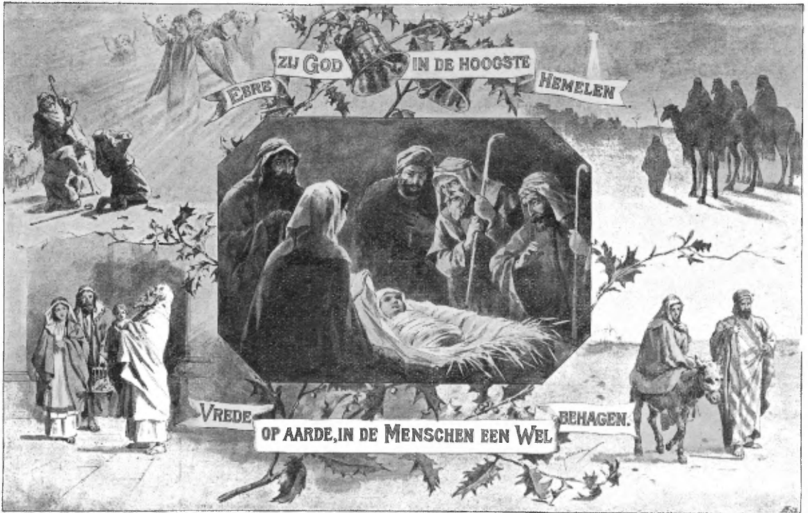
Verkleinde afdruk van de Kerstplaat van Steelink, vermeld op pag. 13.