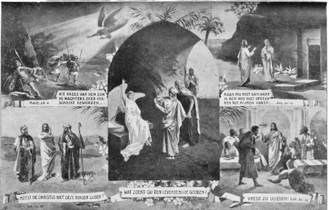
Verkleinde afdruk van de Paaschplaat van Rünckel, vermeld op pag. 13.