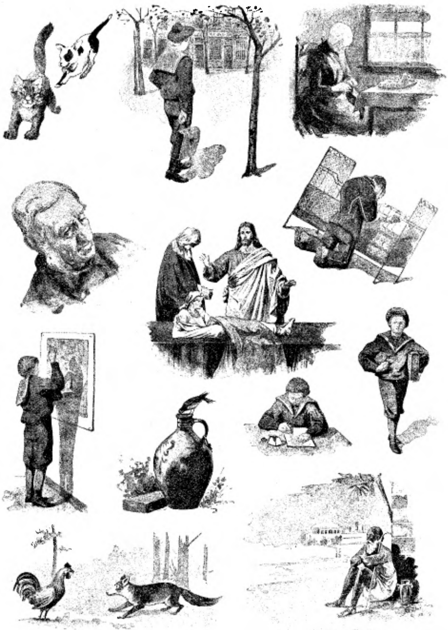
Verkleinde illustraties uit „Hans” en „Vertellen en zingen”.