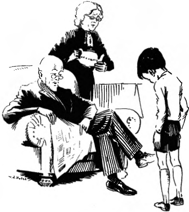
Illustraties van W. G. van de Hulst Jr