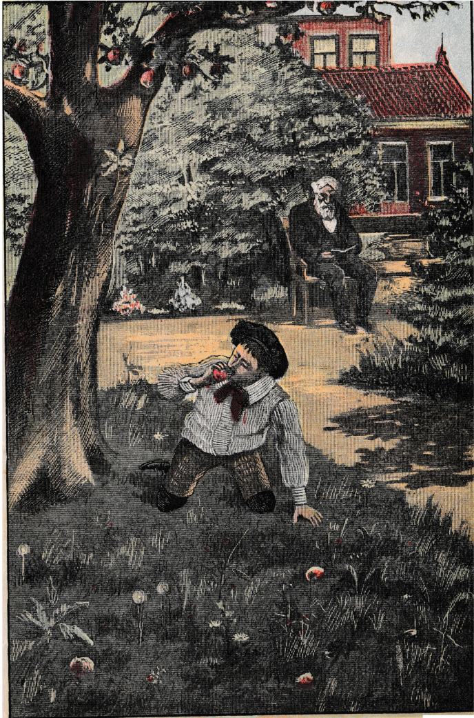
CHROM - TYP. C. C. GALLENBACH NUKERK