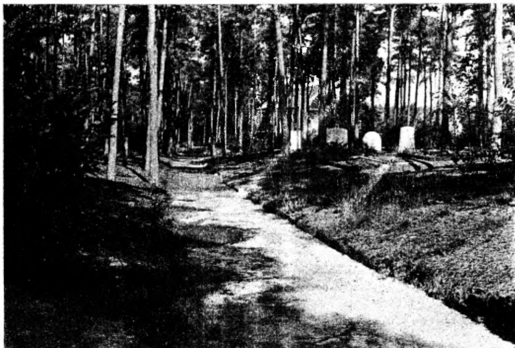
Een kijkje op enkele graven in het bosch.

De Begraafplaats Den-en-Rust ligt een eind ten Westen van de statige Gezichtslaan te Bilthoven. Ze is een gedeelte der Maartensdijksche bosschen. Van de Frans Halslaan af leidt een verharde weg naar de Aula. Deze, uitgevoerd in blank Slavonisch eikenhout, heeft prachtige glas-in-loodramen van Schries en de Ru.