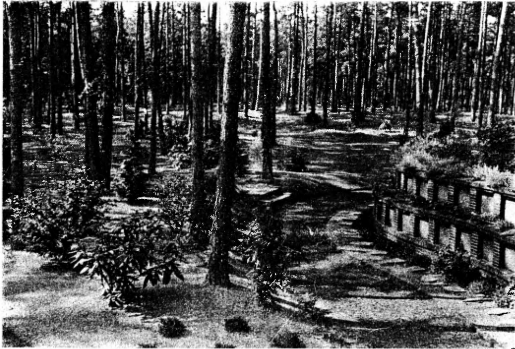
Het ronde bouwwerk, dat de urnen-nissen bevat.

denken, dat het hier een goed oord voor den Seelchenbaum uit het sprookje moet zijn.