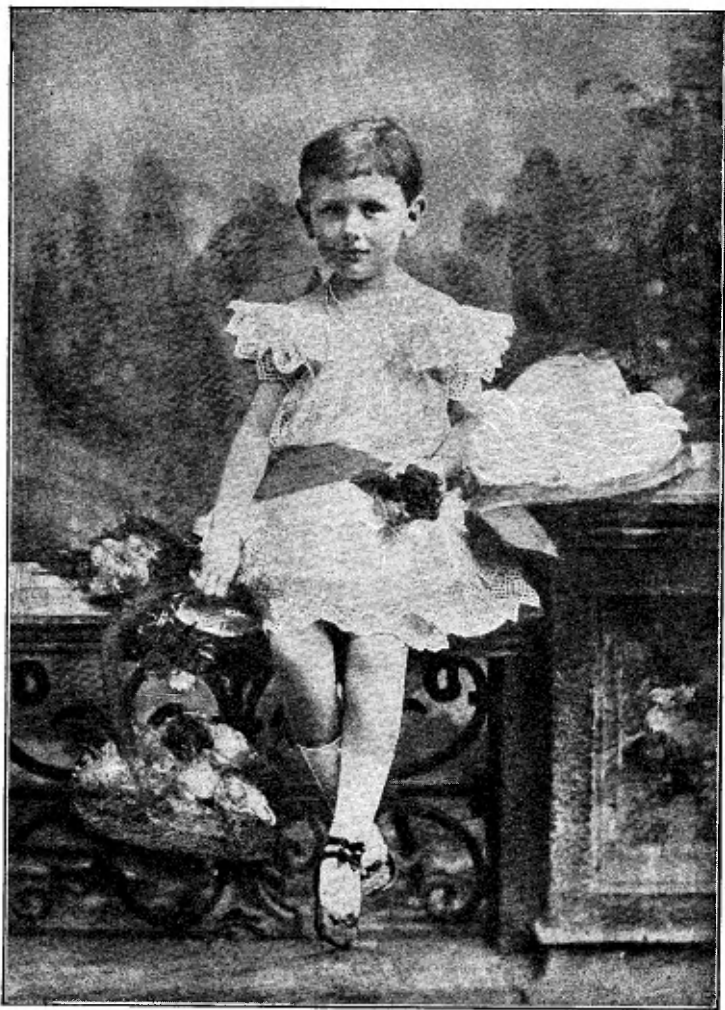
De Koningin als meisje