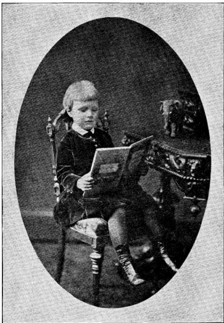
De Prins als jongen