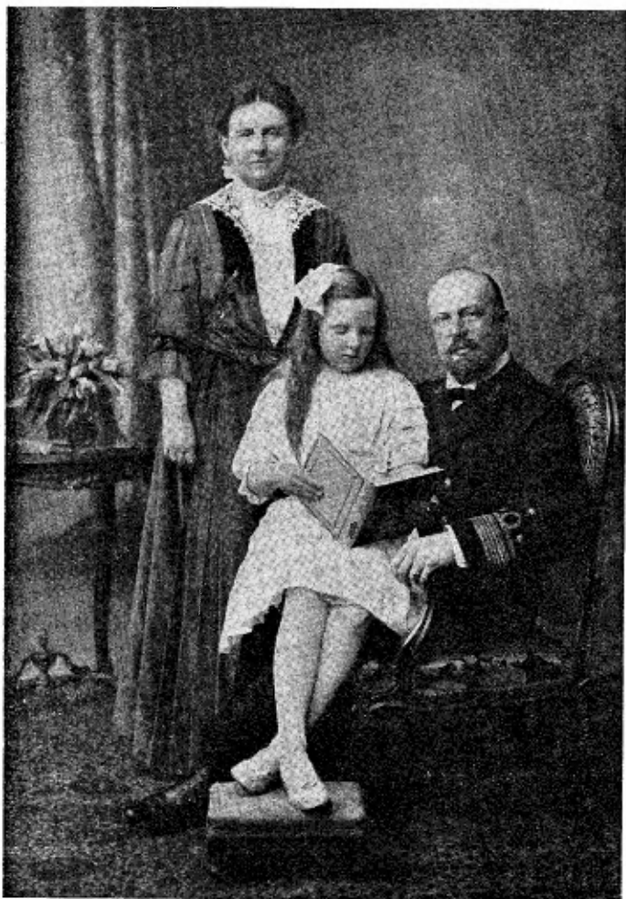
Het koninklijk gezin in 1920