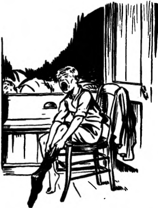
Onder 't aankleden doet hij niets dan gapen.

Door de kleine vierkante ruitjes valt het matte licht van de vroege morgen. In het Oosten zit een oranje streep in de grijze lucht. De zon is in aantocht. Gerke voelt zich groot, hij gaat er ook al in de vroege op uit om geld te verdienen! O, als hij het geluk eens heeft een