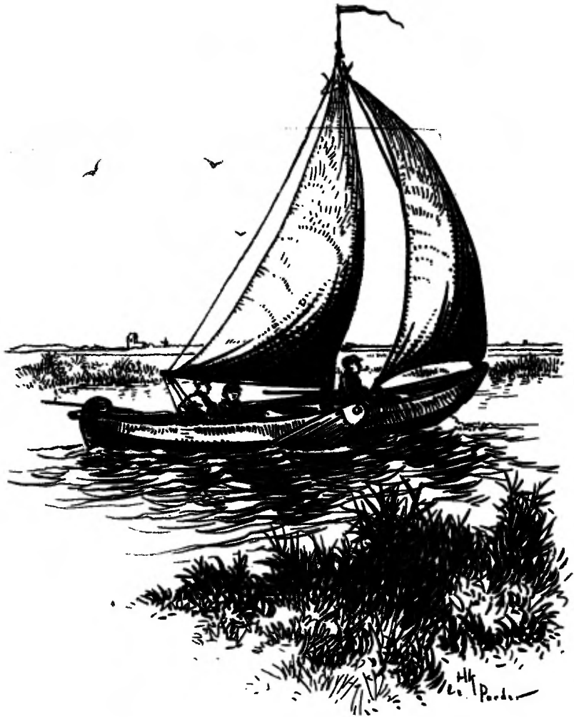
AL VERDER GLIJDT DE PUNTER (Zie blz. 26).