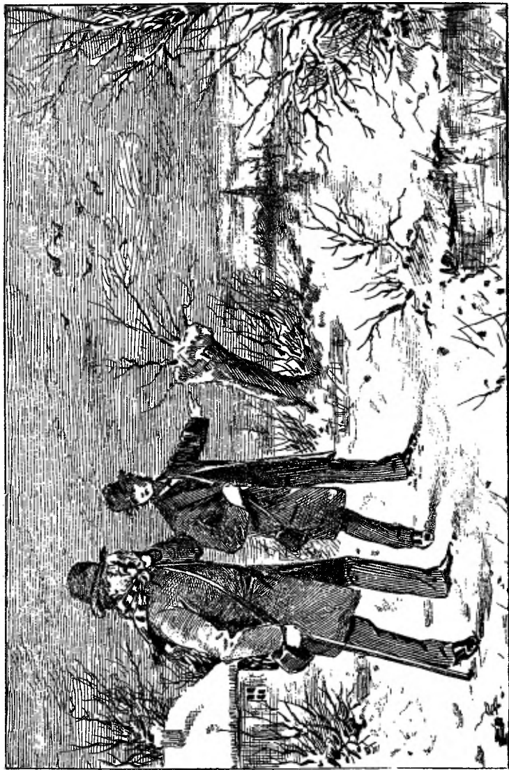
Hoewel Schuurman zelden weende, rolde hem een traan langs de wangen.