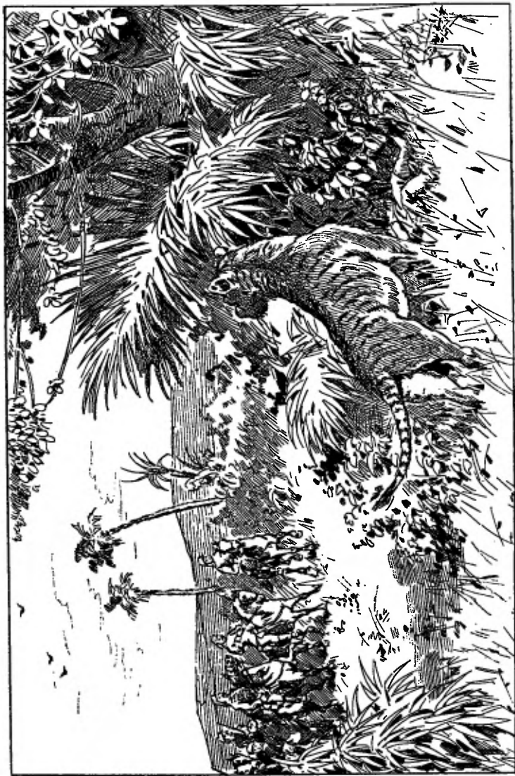
Hij had iets naast zich liggen, dat we echter niet goed konden onderscheiden.