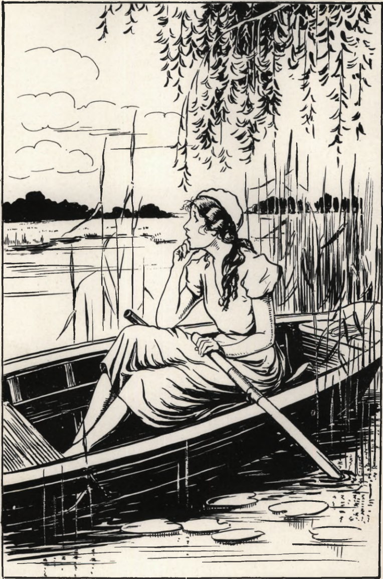
Hier kon ze wat rusten en alles in zich opnemen. (Blz. 155).