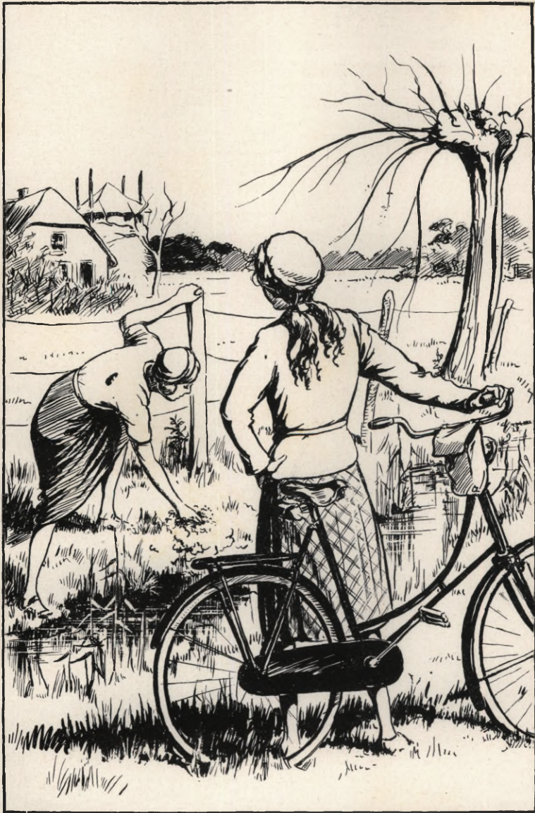
In een oogenblik had ze een bekoorlijk bosje. (Blz. 50).