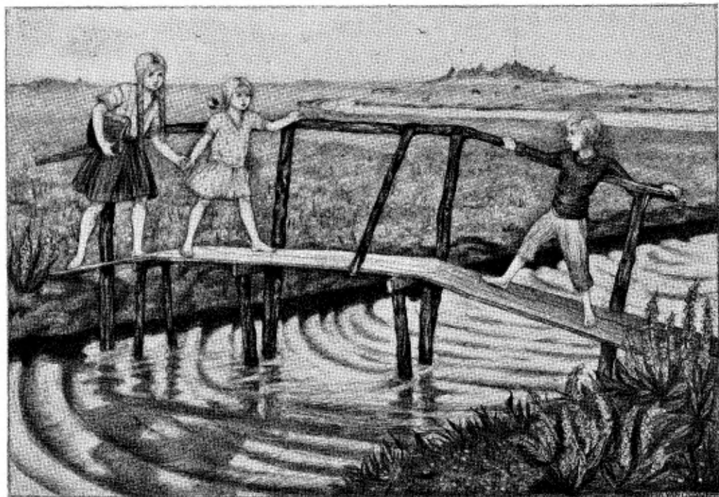
Maar Meri voelde zich niet zeker op de dansende plank (blz. 9)