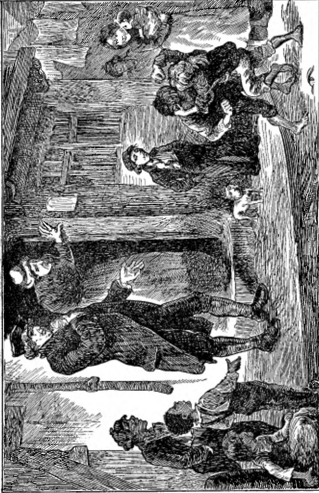
Wat mijnheer Raikes zag in de straten van Gloucester. (Naar een oude houtsneede).