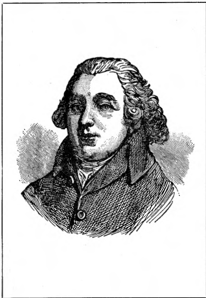
ROBERT RAIKES Geboren 1735 — Overleden 1811.