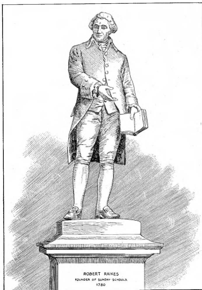
Standbeeld van Robert Raikes aan den Theems-oever te Londen.