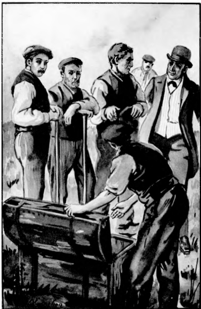
Daar stond de kist — — — de lang vermiste — — — blz. 42