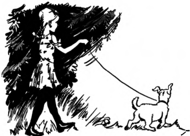
Meta en Greetje.