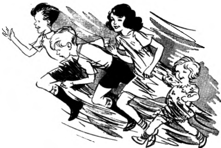
Ze hollen met z'n vieren naar de huisdeur.