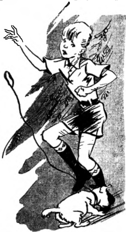
Meta begon in Joops schoenen te bijten.

De kinderen staan nu met z'n allen op de Lage weg, bij het huisje, dicht bij het bruggetje. Ze staan daar al een hele poos,