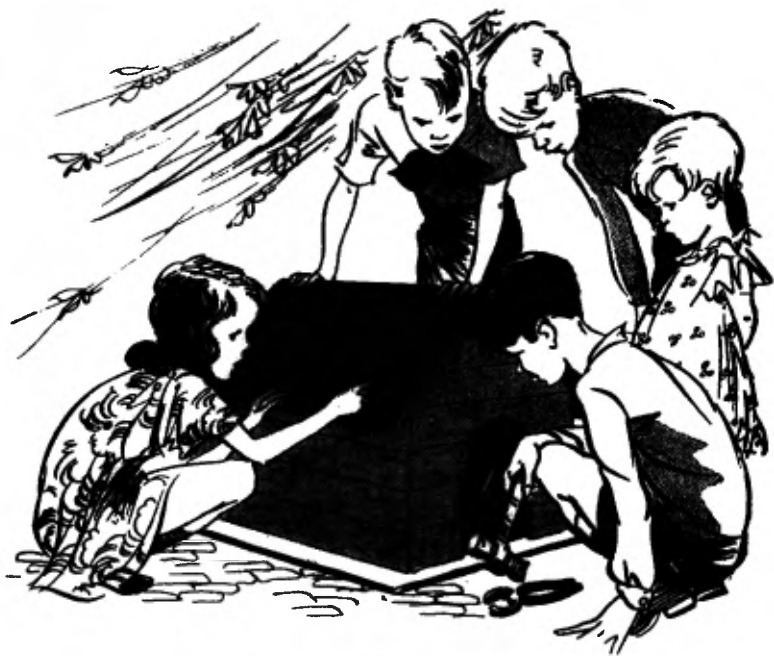
Bij droog weer werken ze buiten.

Kees Bruin kan goed timmeren; die mag meehelpen. En de andere jongens uit de klas mogen ook meedoen, als ze ten minste timmeren kunnen.