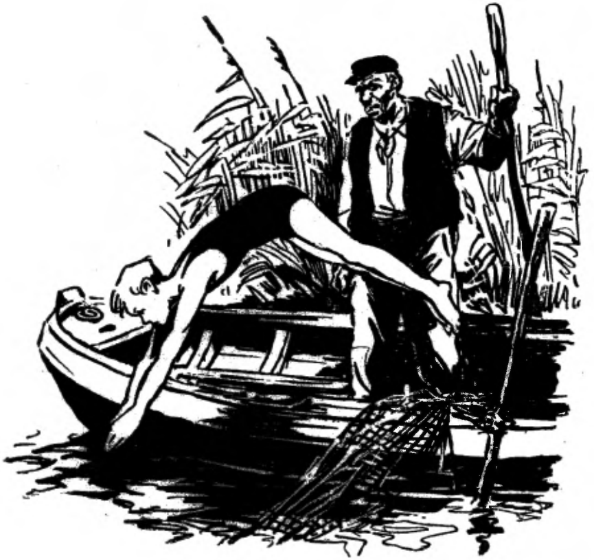
TEKENINGEN VAN JAN LUTZ