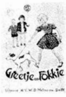
Illustr. N.V. W.D. Mankema, Deilt.

Wéér een herdruk van deze beide mooie boekjes