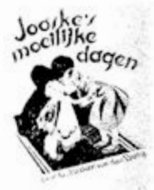
Illustr. N.V. W.D. Mankema, Deilt.

Boekbeoordeling Ned. Herv. Z. S. Bond op G. G.