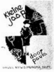
Illustr. N.V. W.D. Mankema, Deilt.