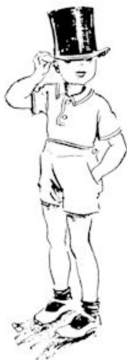
Jammer, dat die hoed voor hem veel te groot is. Blz. 21, no. 50.