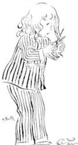
.... en ze knipt: knip, knip, knip! Blz. 17, no. 183.