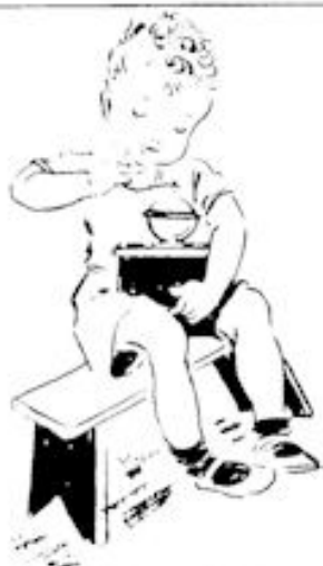
Henkie begint te draaien .... Blz. 21, no. 50.