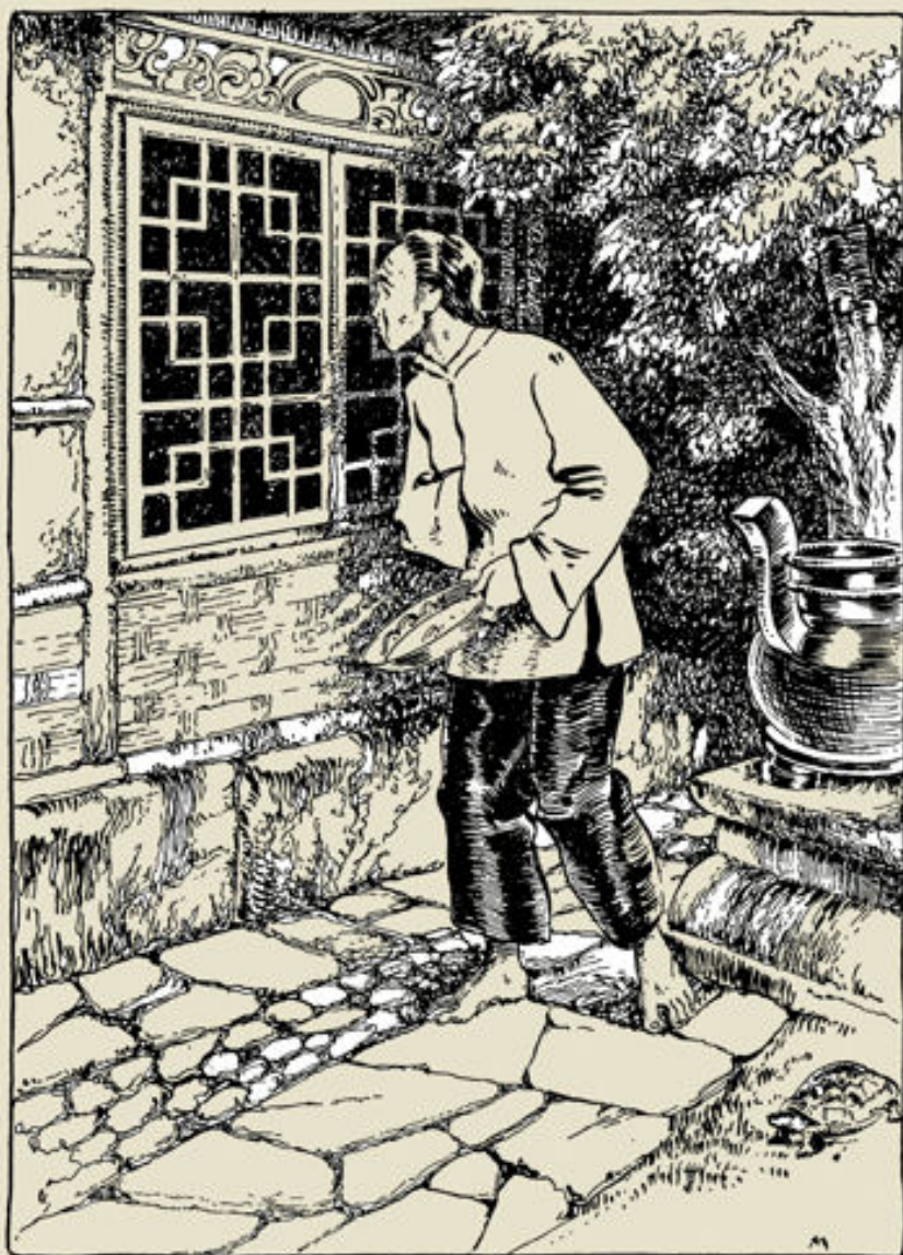
Glurend door het vlechtwerk van één der ramen . . . .

Plaat van Ir M. C. A. Meischke uit: A. Duyser, De Chinese dolk.