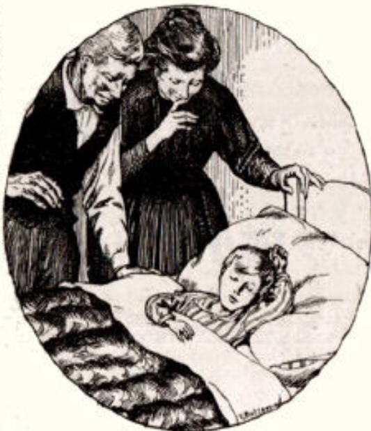
Illustratie van Tj. Bottema uit: Paula, Kleine Jaap.

De verhaalster heeft waarschijnlijk bedoeld, te doen kennen de trouwe zorg des Heeren voor het zaad Zijner kinderen. De brief van de moeder, bedoeld voor haar Jaap, als hij groot geworden zal zijn teekent treffend het geloof in de goedertieren lei-