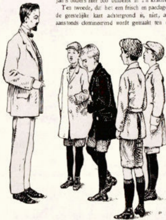
Illustratie van Henk Poeder uit: J. Smelik. Wie zich verhoogt.

Uit conceptief oogpunt is het heel juist, dat nu eens niet aan 't kind werkellyk op eers of andere manier Jan's zin wordt vervuld, zelfs al heeft hij er 'altijd om gebeden. Dat maakt het boekje veel sterker en geeft bovendien de gelegenheid er eens met nadruk op te wijzen, dat zulk bidden verkeerd bidden is. — Hartelyk aanbevolen.