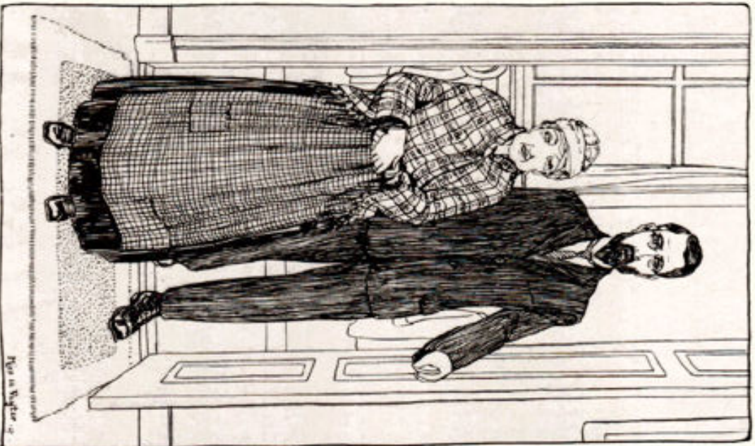
Illustration van Meerp de Puyter uit Gerry, Opus's Verlandag.