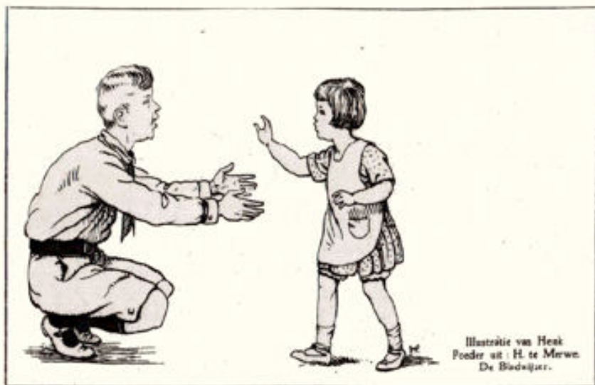
Illustratie van Henk Poeder uit: H. te Merwe. De Bladwijzer.

Dit nieuwe werkje van den schrijver van „Van Keezen, Prais en Oranjeklanten”, is geschikt voor jongens van 9—12 jaar. Het ademt een frisohen geest, en is in vlotten, prettigen stijl geschreven. Het spoort aan tot kinderlijk geloof en vertrouwen.