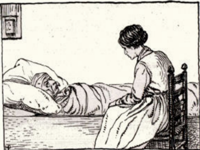
Illustratie van Henk Poeder uit: E. L. Sijma. De Vondslag

Het godsdienstig element ontbreekt hieraan niet.