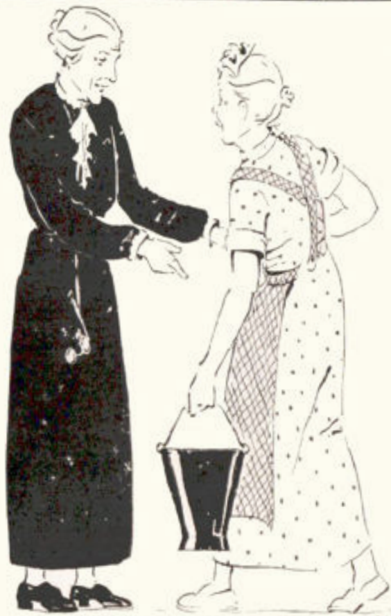
Illustratie van Adri Alindaart: Jok. Brecoort. Om een gestolen postkaart.