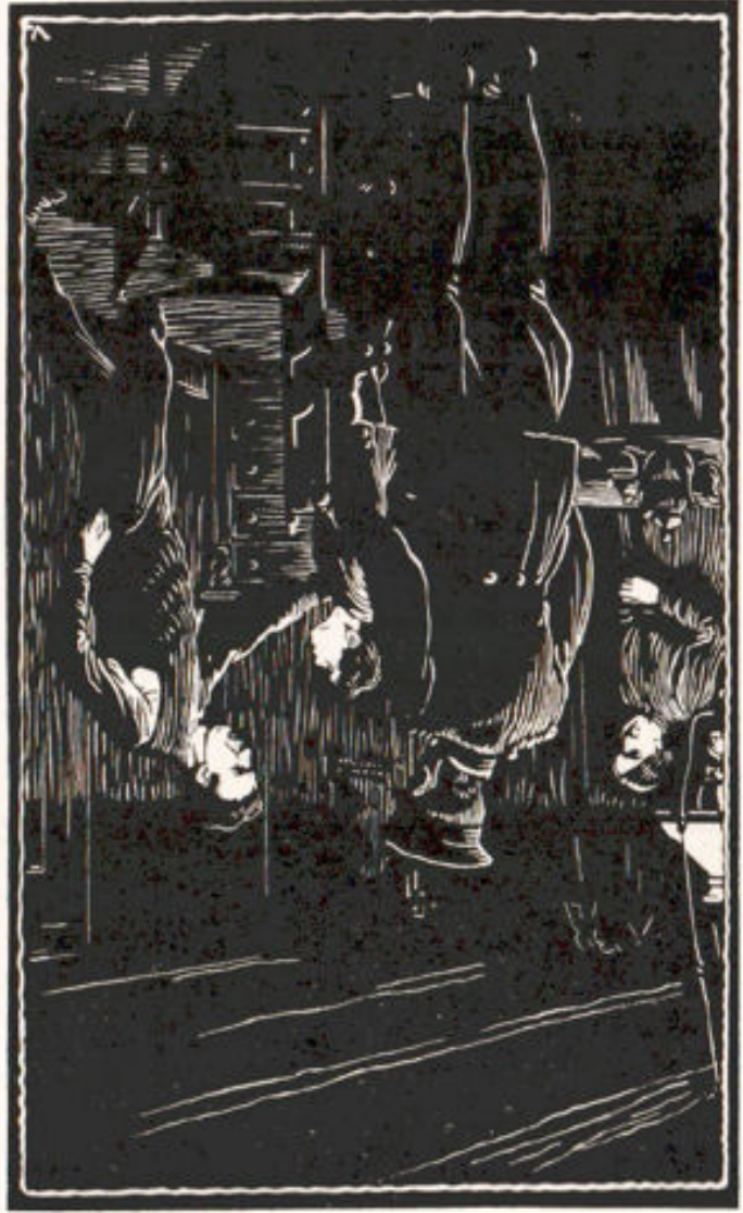
Illustratie van H. J. Vermeulen, uit: P. A. de Rover. Een vreeselijke moord en toch ...