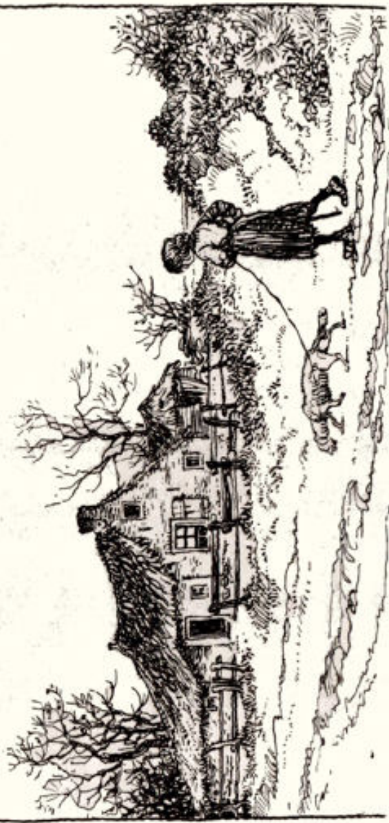
Illustratie van Henk Poelder uit: Job. Breervoort, Miso! Ditsing.