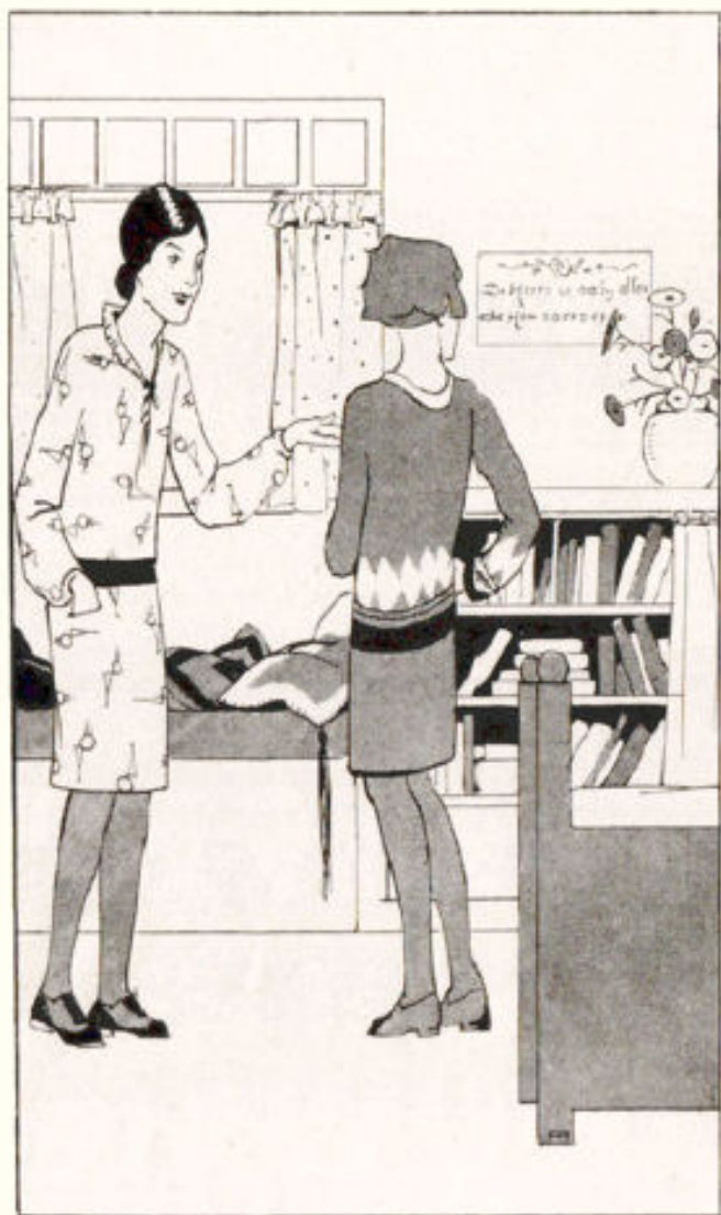
Illustratie van Ado Alinco uit: Carla Onies het vliegende dak.