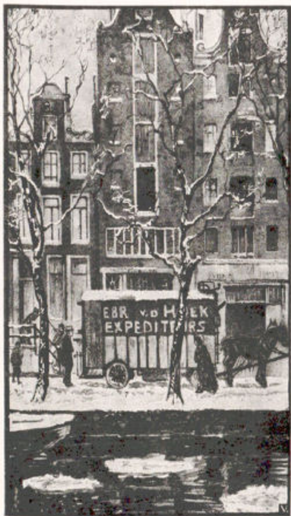
Illustratie van E. J. Verccndal, uit: Willy Verzet, Keine Ruli