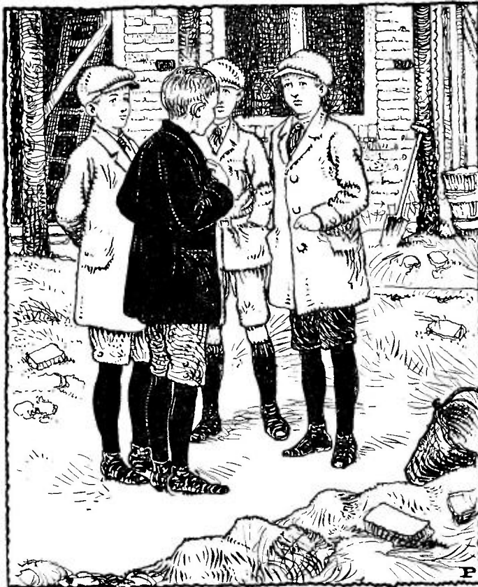
Illustratie uit „WIE ZICH VERHOOGT”.

*J. C. de Koning, Op 't verkeerde pad , met omslag in kleurendruk en 4 binnenplaten. Prijs f 1.—