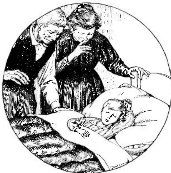
Illustratie uit „KLEINE JAAP“.