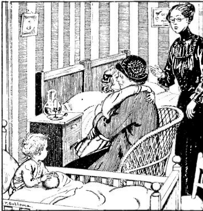
Illustratie uit „JOOSKE'S MOEILIJKE DAGEN”.

G. Kraan—van den Burg, Het Kerstfeest op Oudejaarsavond , met omslag in kleurendruk en illustraties tusschen den tekst. Prijs f 0.35