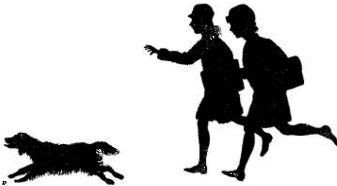
Illustratie uit „SCHOOLVRIENDINNEN”.

Toch meenen wij ook hier het koopen te kunnen vergemakkelijken. Bij bestellen van minstens 10 boeken uit onze bekende STER-EDITIE, berekenen wij deze voor f 1.25 inplaats van voor f 1.50 per stuk.