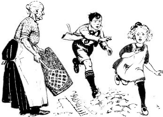
Illustratie uit „WIL EN TIL”

H. te Merwe, Van Keezen, Pruisen en Oranjeklanten , met omslag in kleurendruk en 4 binnenplaten, gecartonn. Prijs f 1.20