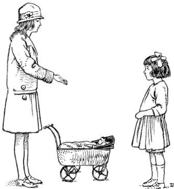
Illustratie uit „SCHOOLVRIENDINNEN“

*Carla, Wil en Til , met omslag in kleuren en plaatjes tusschen den tekst. Prijs f 0.60