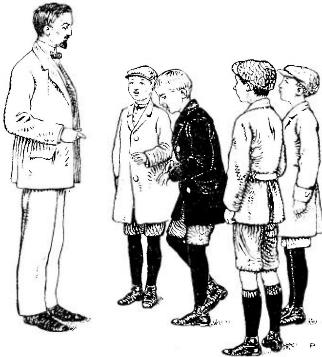
Illustratie uit „WIE ZICH VERHOOGT“.

Voor het cartonneeren wordt door ons niets extra's berekend.