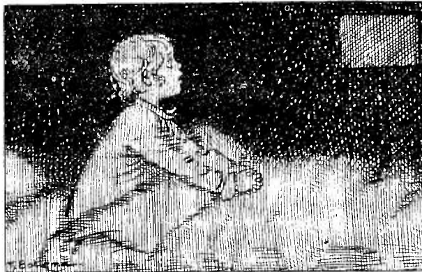
Illustratie uit „WIL EN TIL”.