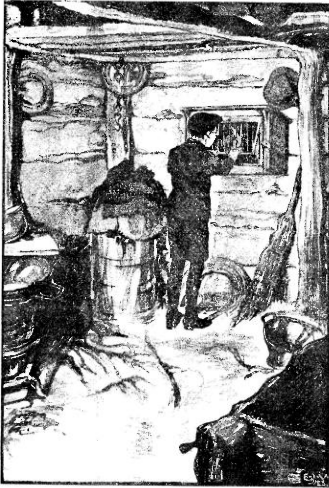
Illustratie uit „OP 'T VERKEERDE PAD”.