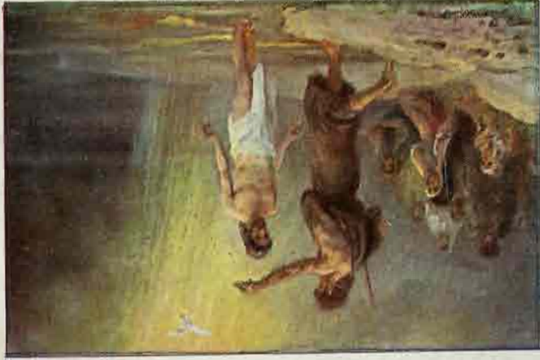
58. Jezus wordt door Johannes gedoopt