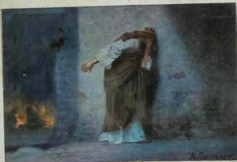
83. Petrus berouw, na de verloochening.