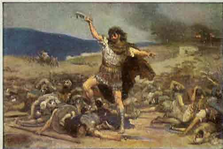
31. Simson verslaat de Filistijnen