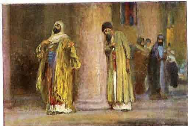
74. De gelykents van den Pharizeër en den Tollenaar.