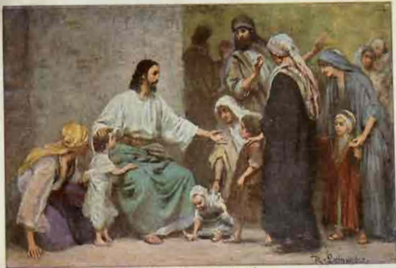
63. Jezus de kindervriend.