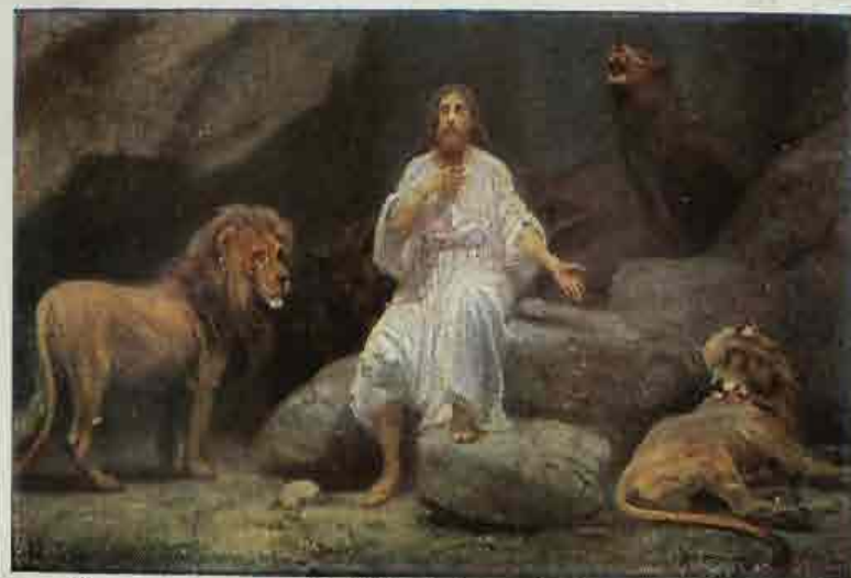
50. Daniël in den leuwenkuil