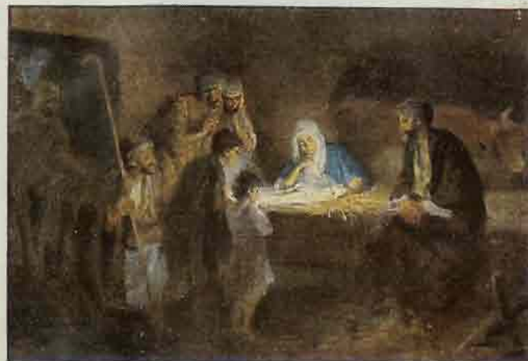
52. De herders bij het Kindeke.