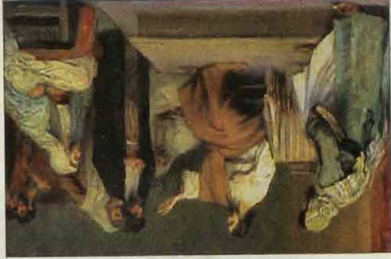
60. Jezus in zijn vaderstad.