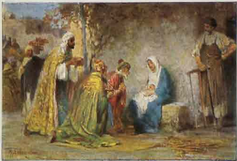
53. De wijzen uit het oosten