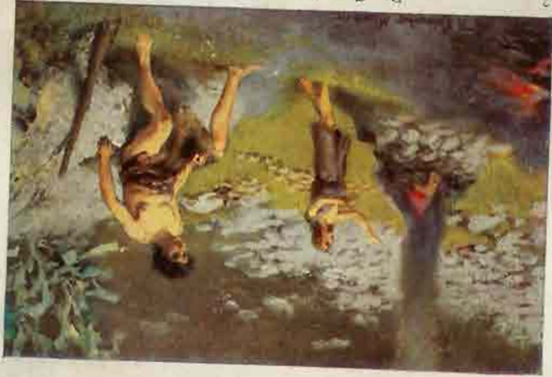
De offerande van Kain en Abel