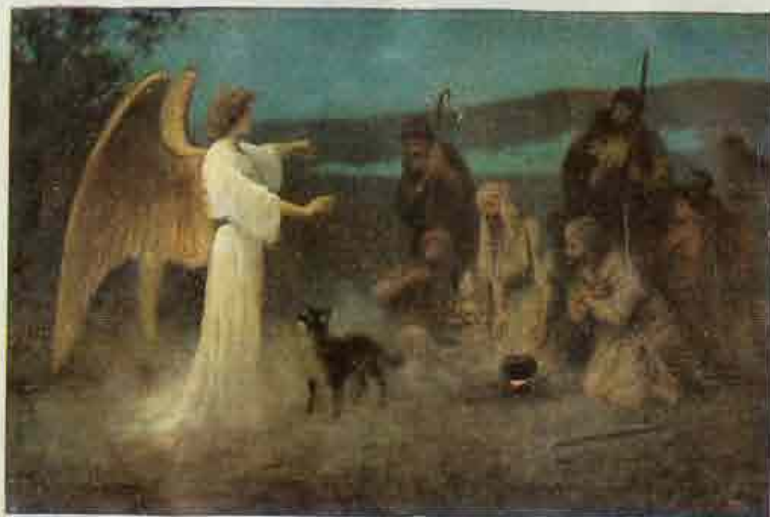
51. De verkondiging van Jezus' geboorte.