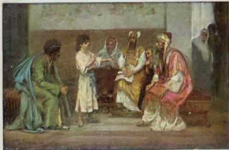
56. De twaalfjarige Jezus in den tempel