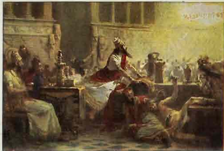
49. Belsazar's maaltijd „Mené, Mené!”