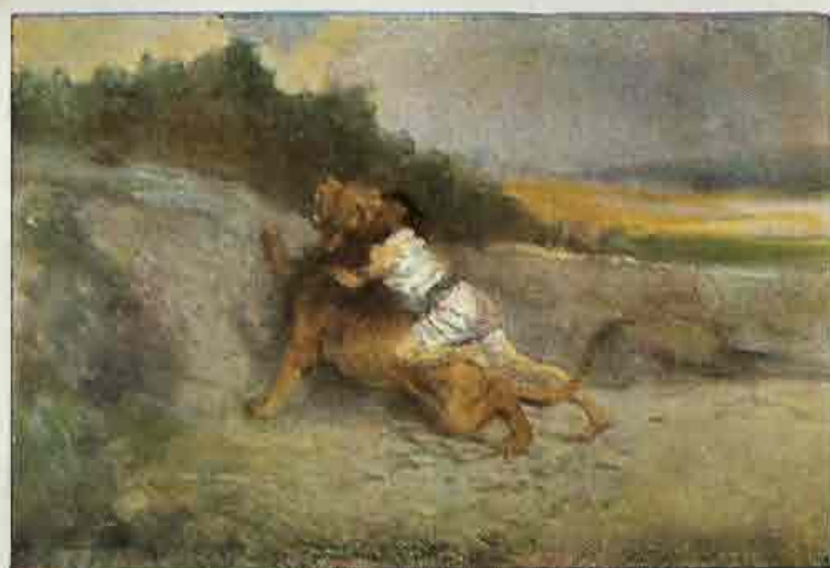
30. Simson verscheurt een leeuw