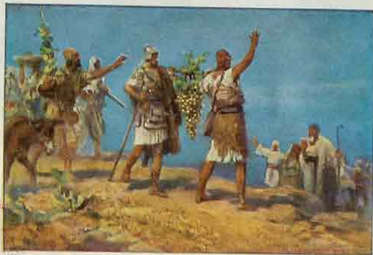
23. De verspieters keeren terug.