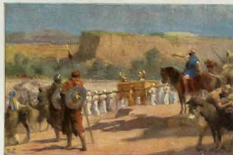
24. Israëls doortocht door den Jordaan.