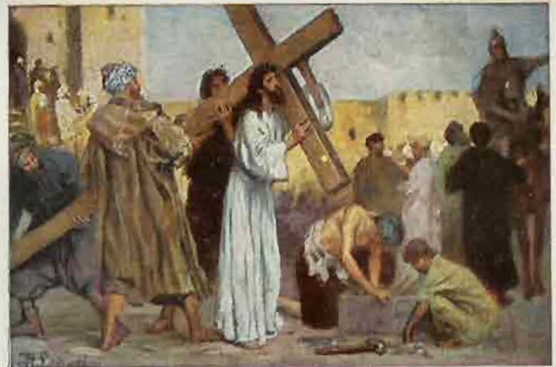
86. De kruisgang naar Golgotha.