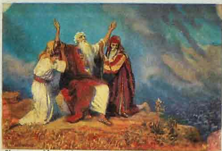
21. Mozes bidt, gesteund door Aäron en Hur.