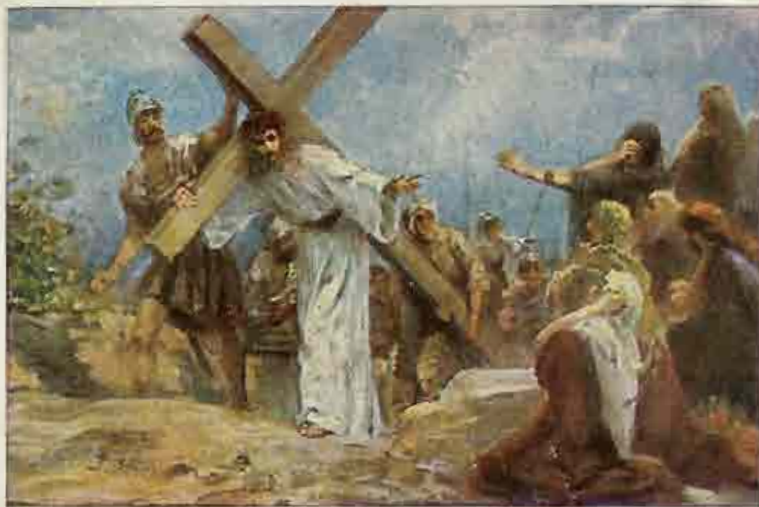
87. Jezus spreekt tot de dochters van Jeruzalem.