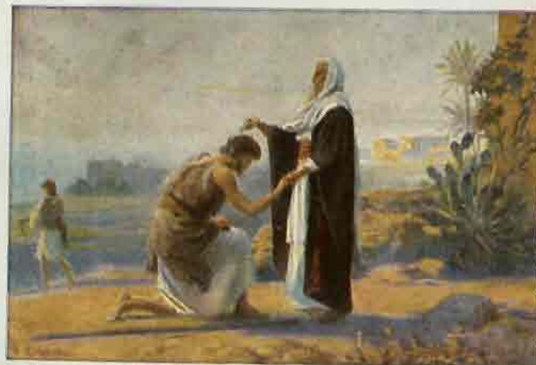
36. Saul, door Samuël tot koning gezalfd.