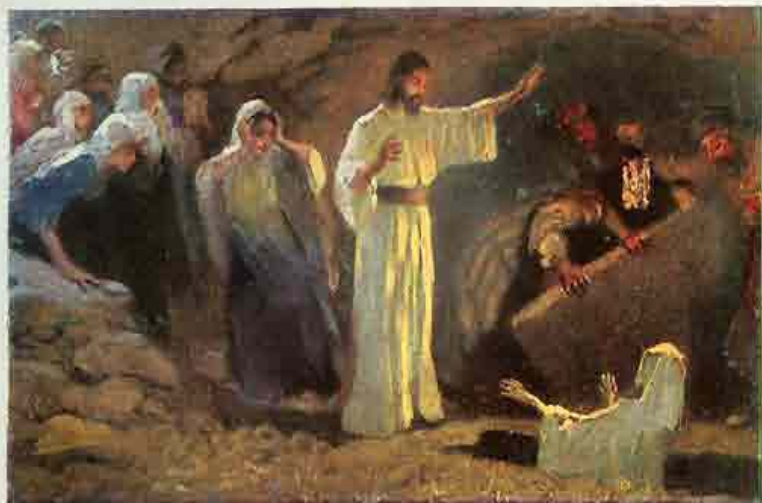
73. De opwekking van Lazarus