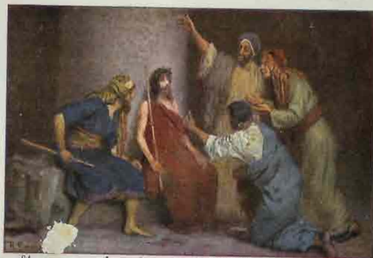
84. Jezus, door zijne vijanden bespot.