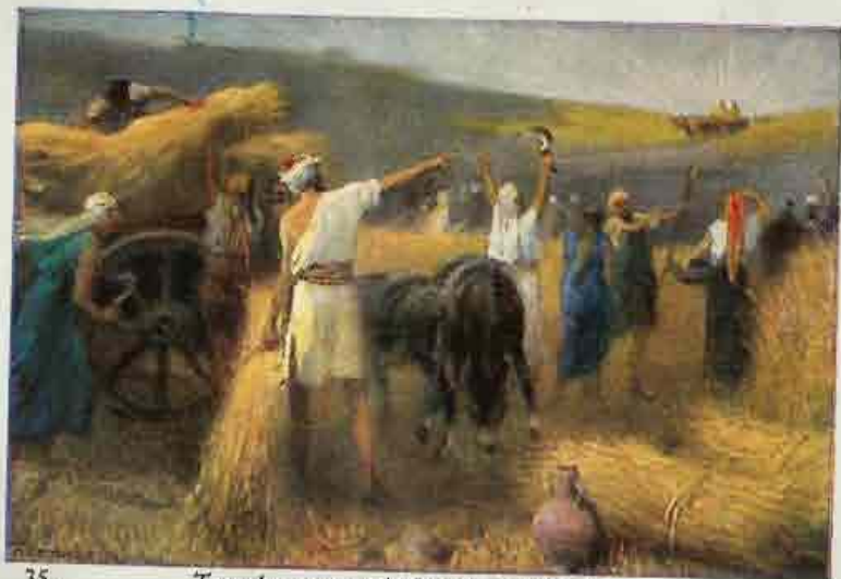
35. Terugkomst van de Ark des verbonds.