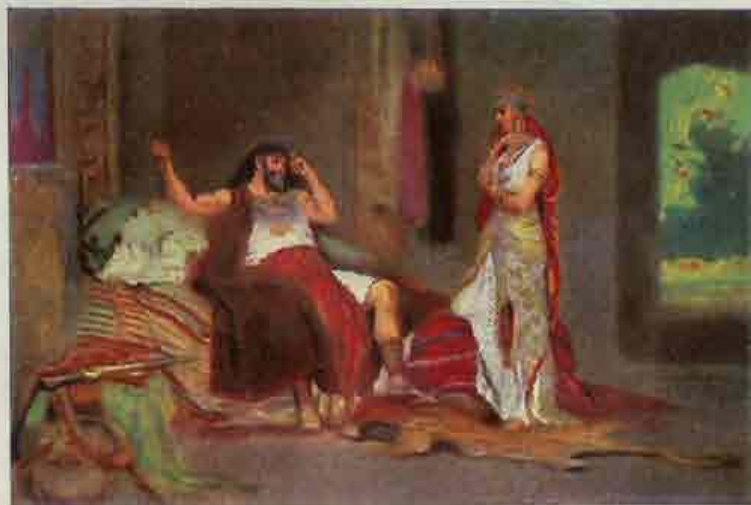
32. Simson en Delila