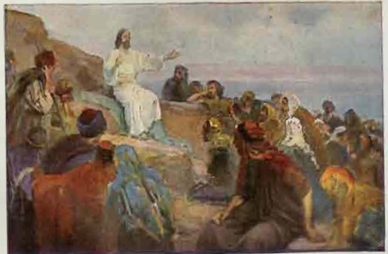
64. De Bergrede.