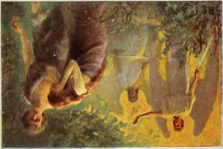
Adam en Eva uit het Paradijs verdreven