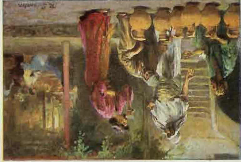
59. De bruiloft te Kana.