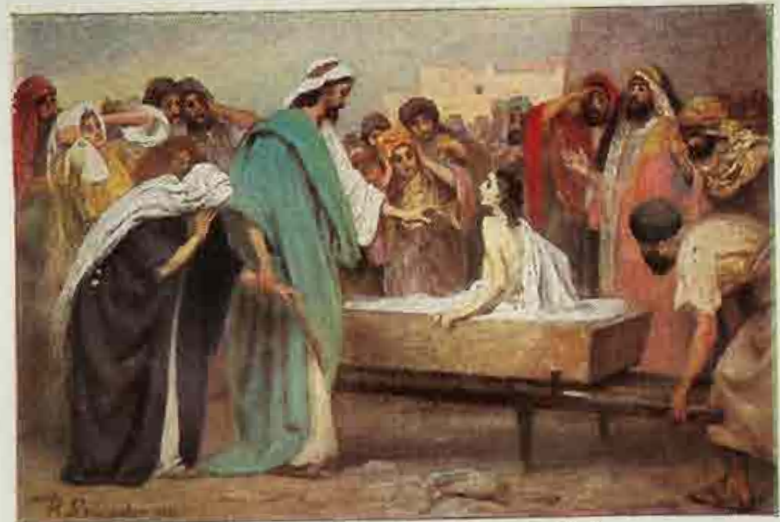
62. De opwekking van den jongeling van Nain