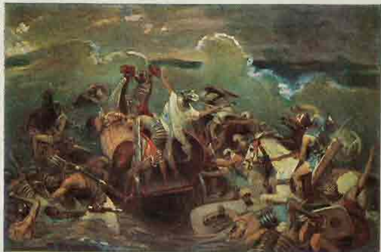
19. Faraö en zijn leger komen on-