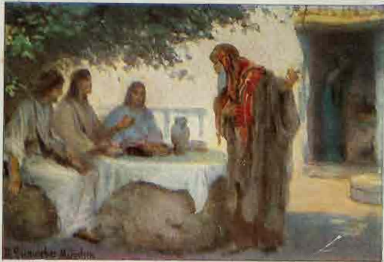
5. De drie engelen bij Abraham.