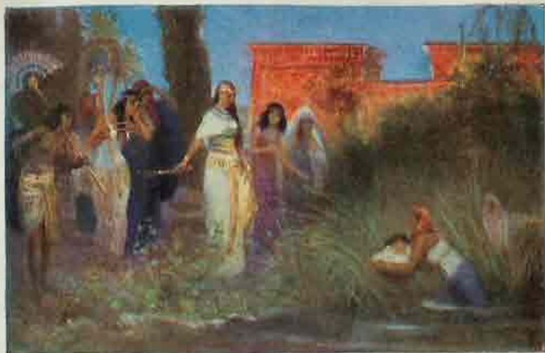
17. Mozes uit het water gered