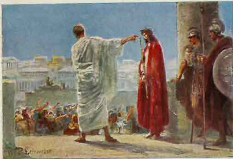
85. Jezus voor Pilatus. „Zie de Mensch!“