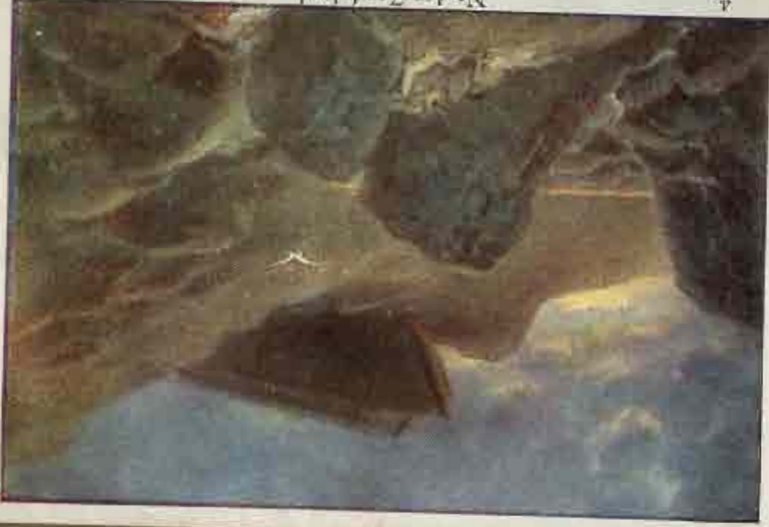
Na den Zondvloed