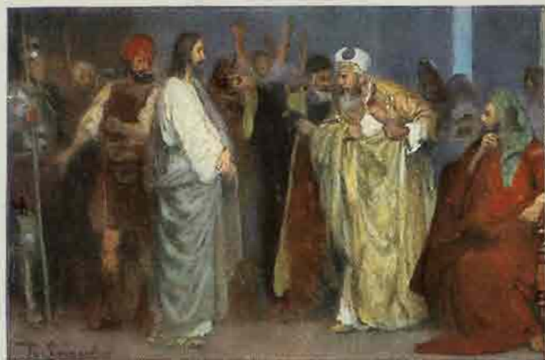
82. Jezus vor Kajafas