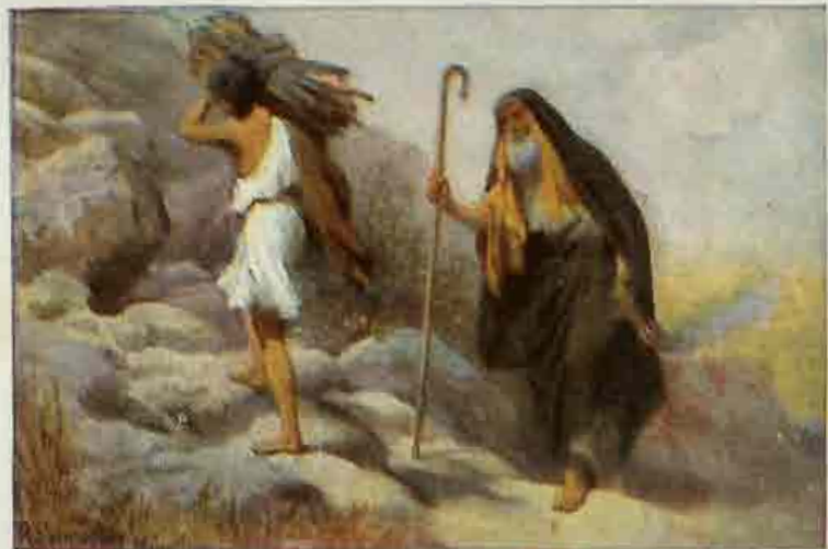
8. Abrahams offerande.