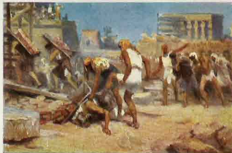
16. Israël in dienstbaarheid