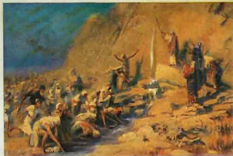
20. Israël ontvangt water uit de rots