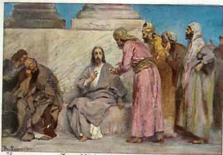
75. „Toont Mij den schattingpenning“