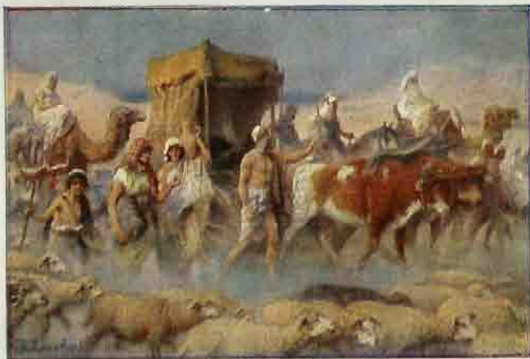
15. Jacob trekt af naar Egypte