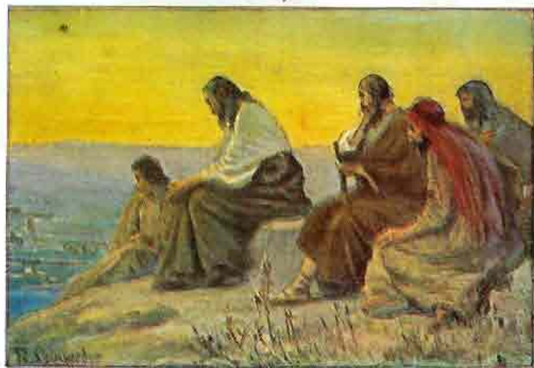
76. Jezus weent over Jeruzalem