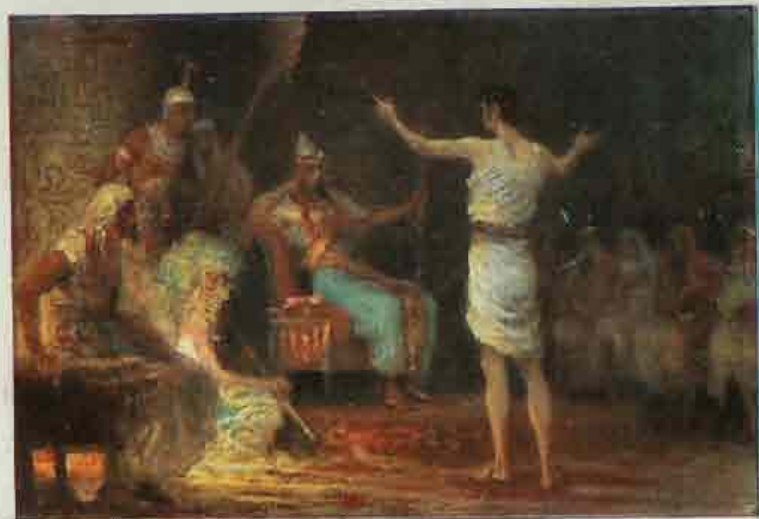
13. Jozef verklaart Faraos' droomen