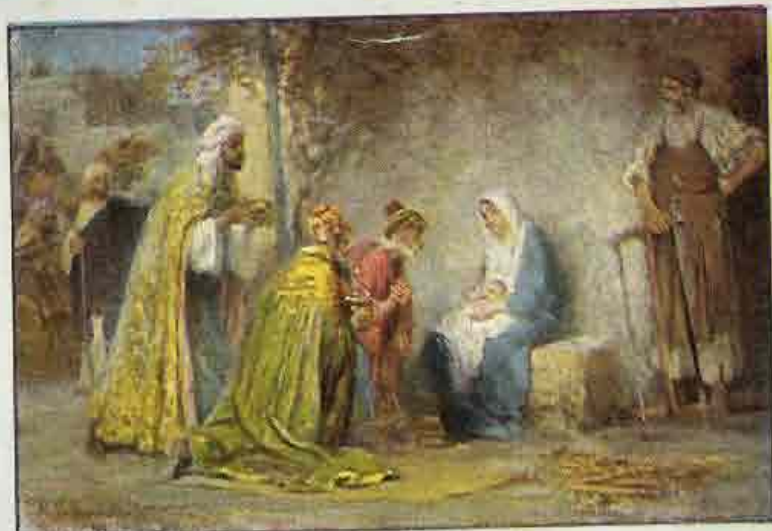
54. De wijzen uit het oosten