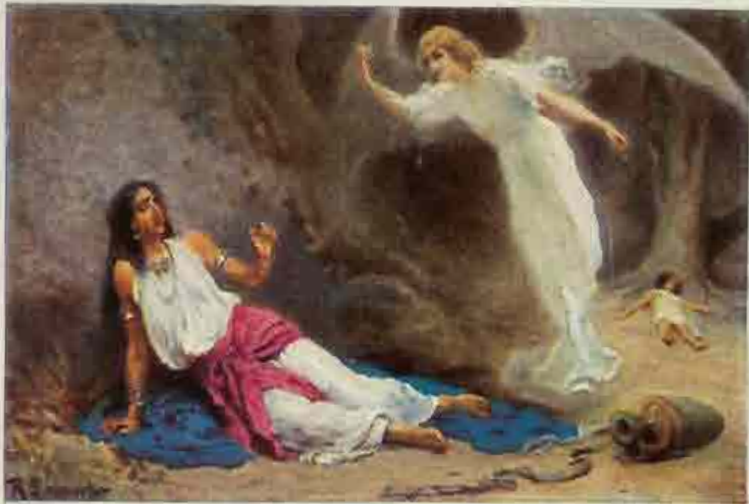
7. Hagar en Ismaël in de woestijn