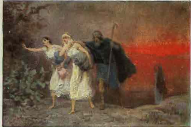
6. De vlucht van Lot uit Sodom