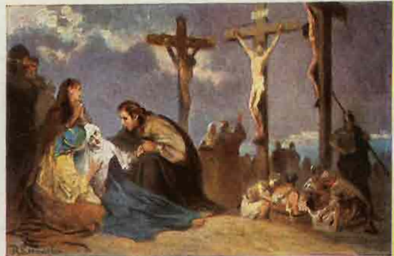
88. Jezus aan het kruis