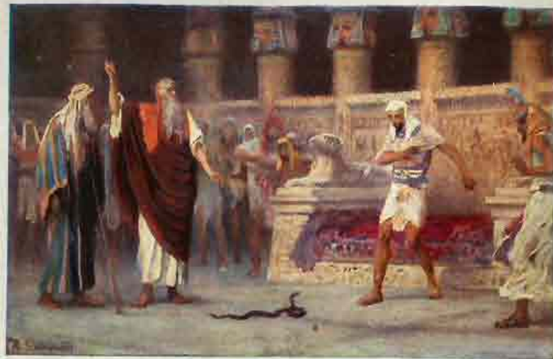
18. Mozes en Aäron voor Faraö