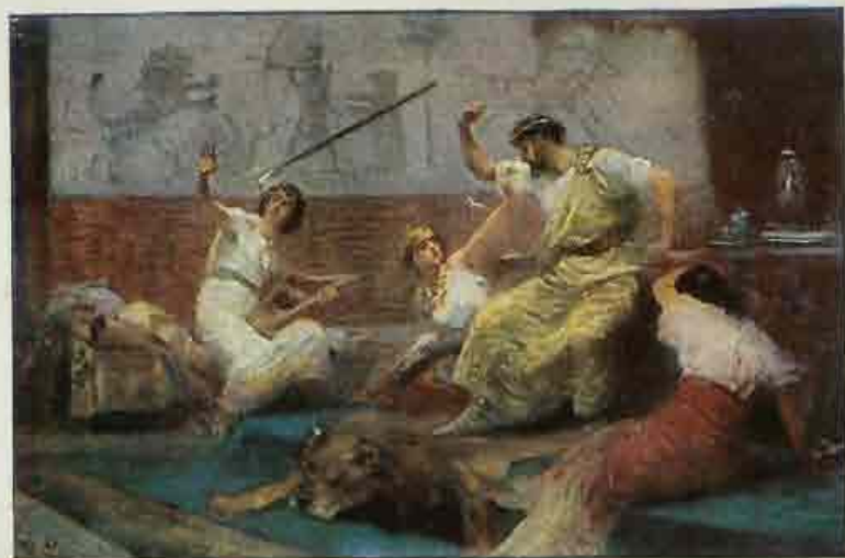
33. Saul werpt met een speer naar David.