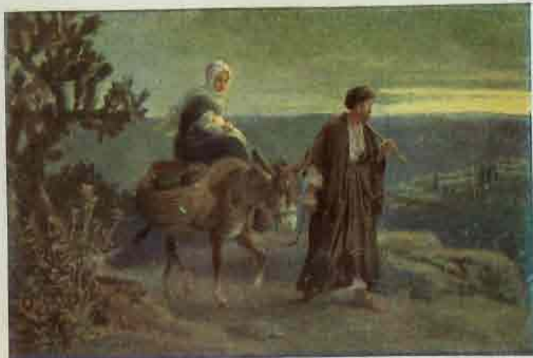
55. De vlucht naar Egypte