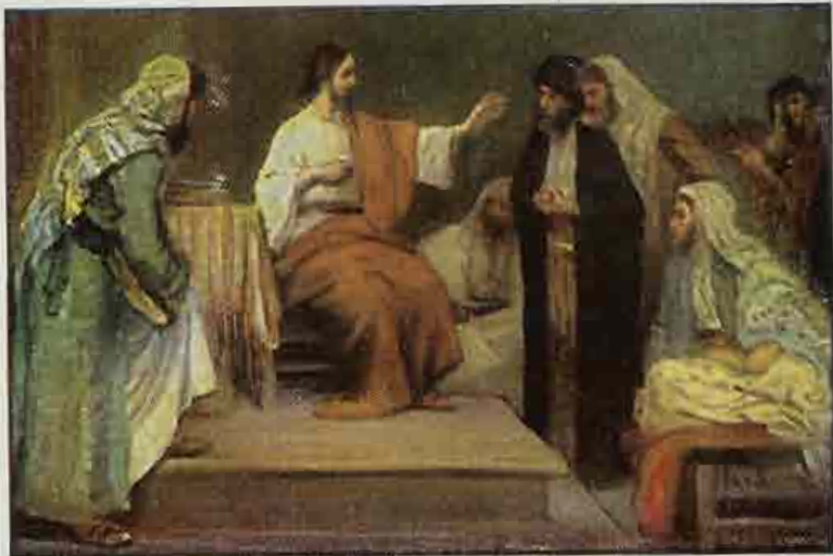
61. Jezus in de Synagoge te Nazareth.