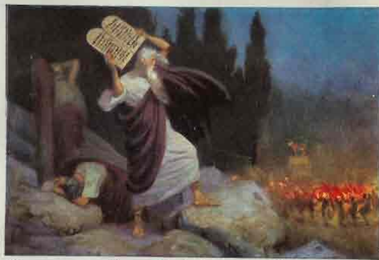
22. Mozes verbreekt de steenen tafelen