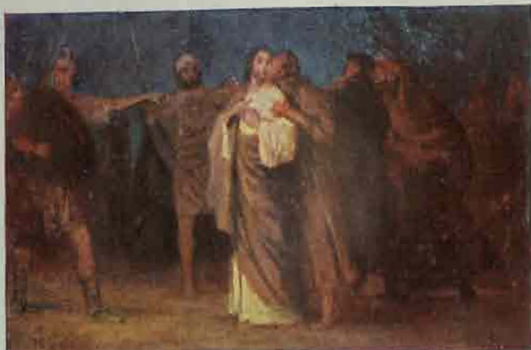
81. Jezus door Judas verraden