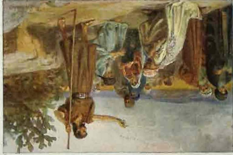
57. De prediking van Johannes den Dooper.