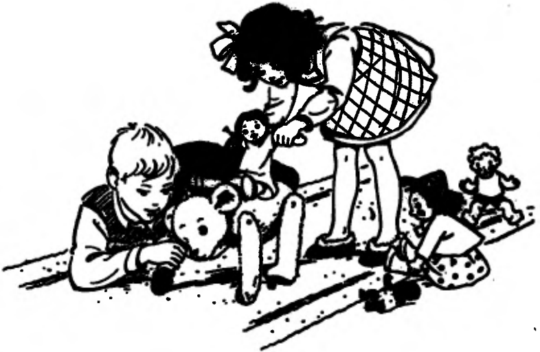
Stevig houdt hij de beer vast.