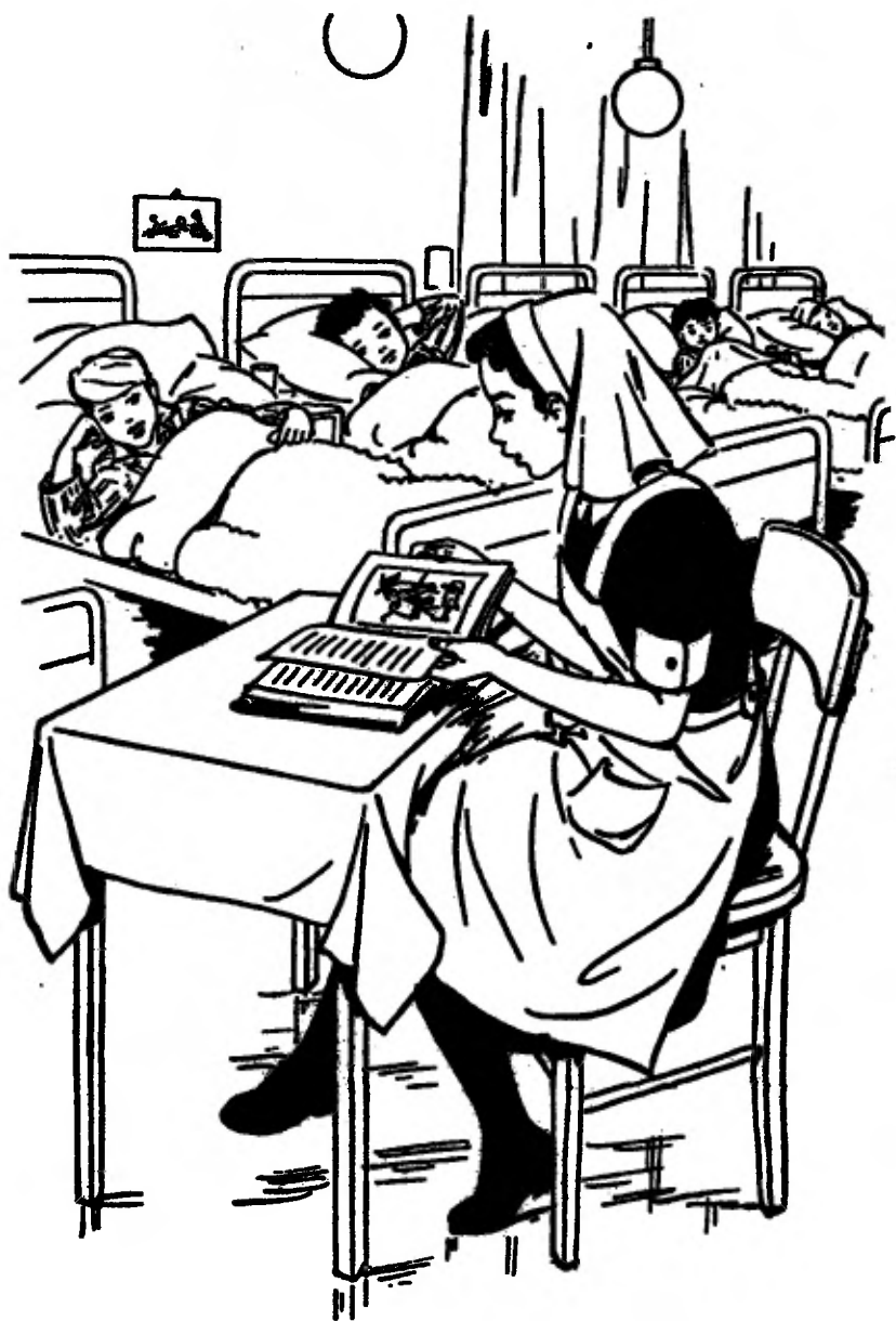
Zuster Anneke doet het grote boek open (zie pag 25).